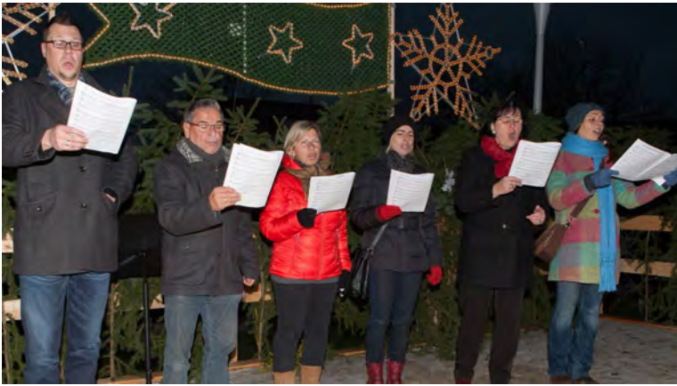
...der Musica Aspencensis...