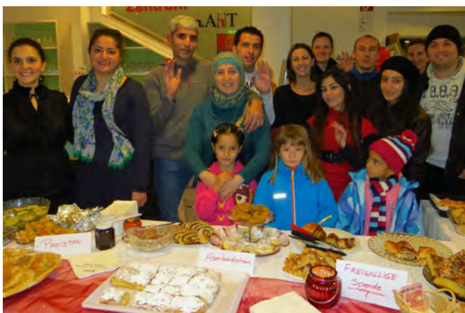
Foto: Das interkulturelle Buffet als Zeichen der Verständigung