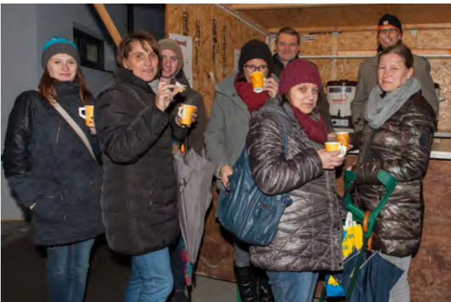
...trugen zum Erfolg der Veranstaltung bei.