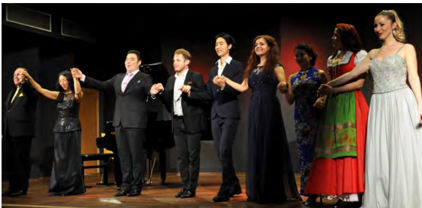
Foto: Die jungen Künstler sorgten für Begeisterung beim Publikum