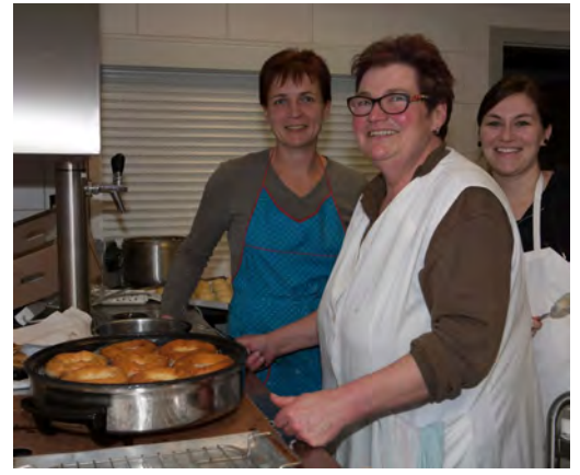
...und typische kulinarische Leckerbissen...