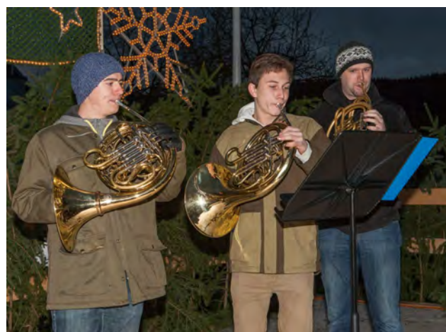
...gekonnte Darbietungen der Musikschule...