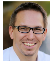
Bildungsgemeinderat Mag. Markus Schmid

Aus der Vielfalt der Kulturen und Generationen zu lernen, wird beim Projekt „Mutig voneinander lernen“ großgeschrieben. Das Projekt „Mutig voneinander lernen“ bot im Schuljahr 2014/15 den Kindern der vierten Klasse und Erwachsenen eine Plattform, um aus der Vielfalt der Kulturen und Generationen zu lernen. Ein Jahr lang erzählten Groß und Klein einander in der Volksschule Kematen aus ihrem Leben und von ihren Schulgeschichten. Mutig lernten Menschen mit und ohne Migrationsgeschichte miteinander zu Themen wie Identität, Kultur, Vorbild und Schule.