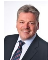
Kraft Franz EU-Gemeinderat