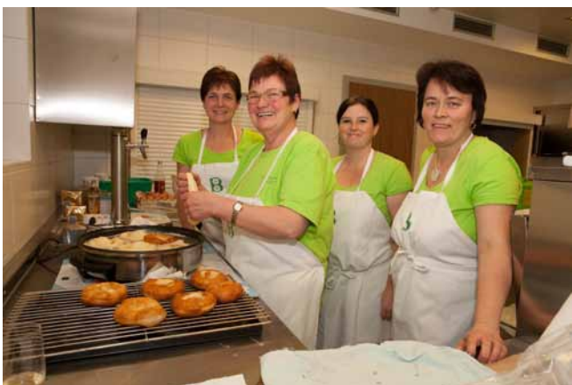
...ein Adventmarkt mit kulinarischen Leckerbissen...