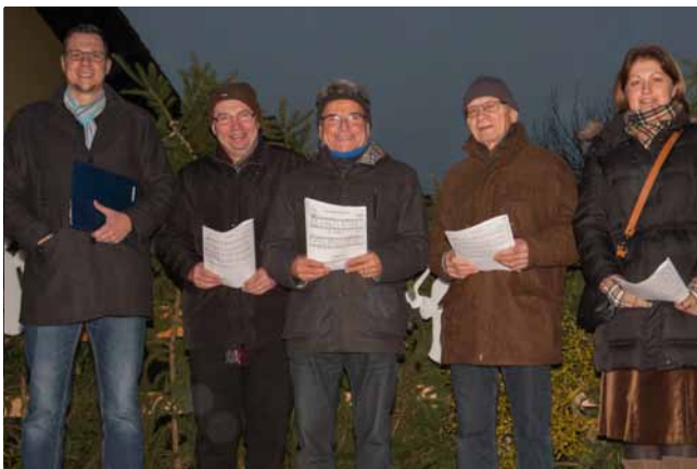
Stimmungsvolle Darbietungen der Musica Aspacensis...