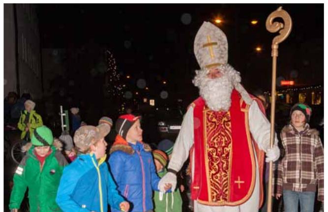
...und ein Nikolausbesuch, trugen zum Erfolg der Veranstaltung bei.