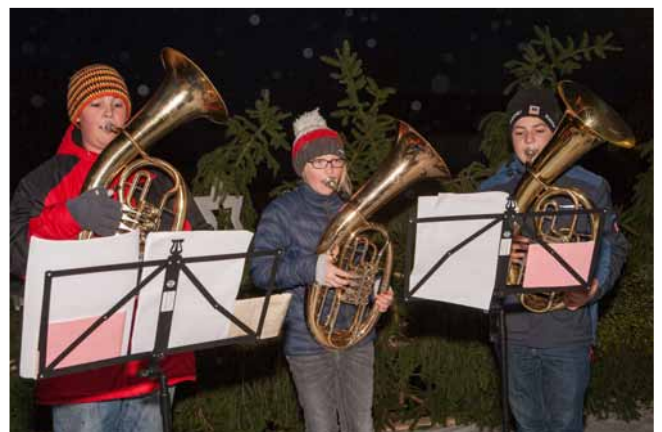
...der Musikschule, sowie...