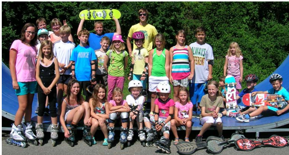
Mit Spass und Begeisterung bei der Sache: die Skatergruppe