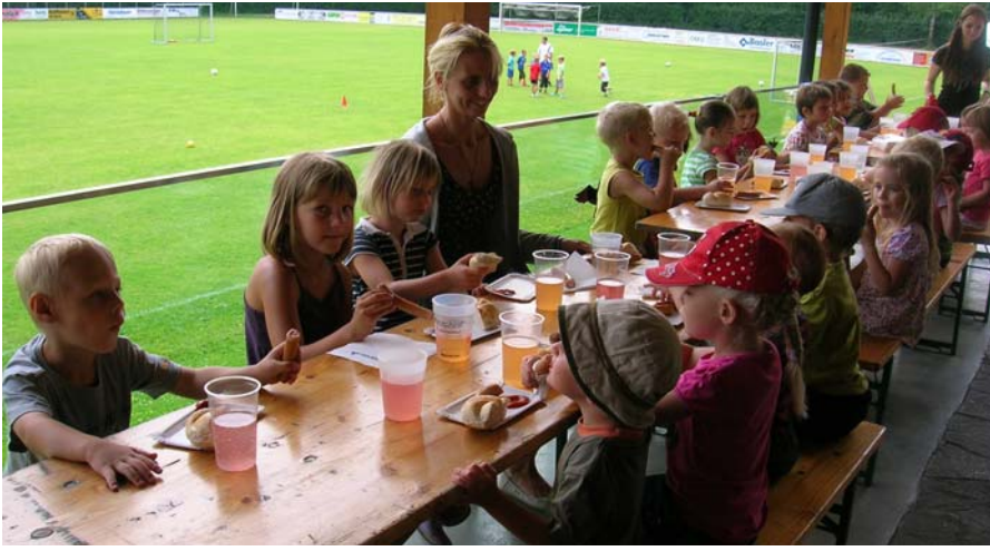
Die kindergerechten Menüs schmeckten allen hervorragend