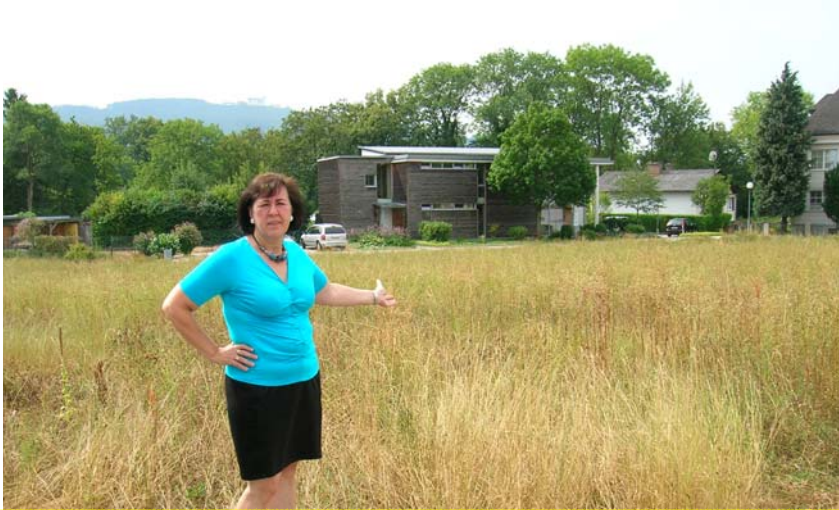
In Kürze wird auf diesem Areal mit dem Bau der neuen Wohnhausanlage begonnen

So konnten für die in Kürze beginnenden Bauarbeiten für 22 seniorengerechte Wohnungen beim „Betreuten Wohnen“ der GEDESAG alle vertraglichen und rechtlichen Voraussetzungen abgeschlossen werden. Darüber hinaus ist es aufgrund des besonders guten Einverständnisses mit der Straßenmeisterei Waidhofen/Ybbs möglich geworden, die bisher als Schotterweg vorhandene Verbindungsstraße zwischen der 13.b Straße und dem Zeughaus der FF. Kematen zu befestigen und im Interesse der Anrainerschaft auch staubfrei zu machen.