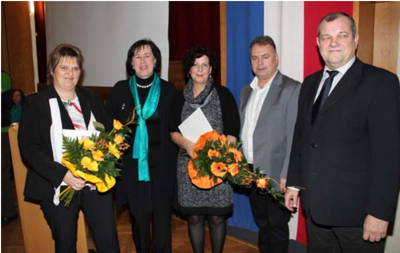
Ein herzliches „Danke“ für 25 Jahre vollste Zufriedenheit in der Gemeindestube und in der Volksschule