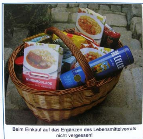
Beim Einkauf auf das Ergänzen des Lebensmittelvorrats nicht vergessen!

Falls die Versorgung in einem Katastrophenfall beeinträchtigt wird, werden die verantwortlichen Stellen versuchen zumindest eine Notversorgung so rasch wie möglich herzustellen. Um zu verhindern, dass aus einem Versorgungsengpass eine Gefährdung für die Bevölkerung entsteht, muss jeder Einzelne vorsorgen!