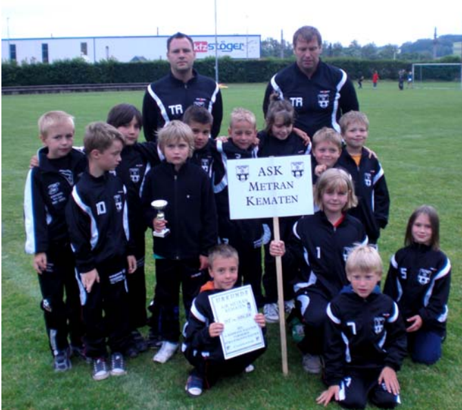
Foto oben: die erfolgreiche U8 Mannschaft beim Turnier in St. Valentin