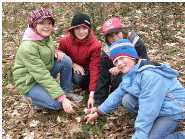
Auch junge Wanderer nahmen begeistert teil

Bereits zum 5. Mal wurde der Schneerosenwandertag vom Kulturreferat der Gemeinde veranstaltet. Bei gutem Wanderwetter waren rund 100 aktive Wanderer bereit, die „Frühjahrs müdigkeit“ abzuschütteln und sich entlang des Kematner Schneerosenweges an der bereits erwachenden Natur zu erfreuen und erste zaghafte Frühlingsboten zu entdecken.