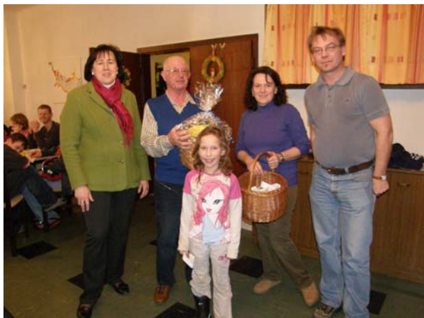
Unter den Teilnehmern wurden Sachpreise verlost