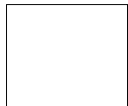
Kontrollstempel 4 (Ziel)

Ab drei Kontrollstempel gilt dieser Abschnitt als GUTSCHEIN FÜR EIN GETRÄNK !