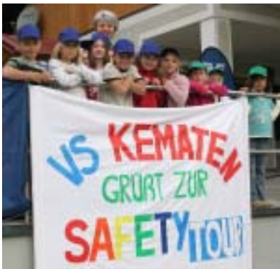
Nach der feierlichen Begrüßung...