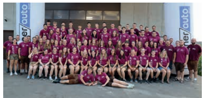
^^ Anlässlich des Jubiläumsjahres finden heuer gleich zwei große Veranstaltungen statt: Neben dem traditionellen Fest „Voi am Limit“ am 14. August lädt die Landjugend auch zum Frühschoppen am 16. August ein.