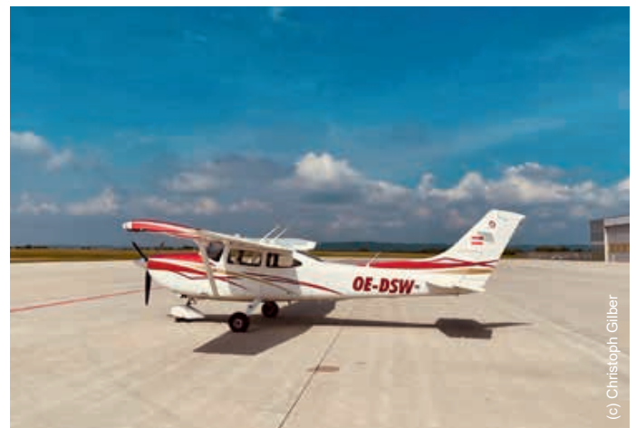
^^ Mit einer 480 Meter langen Piste, 12 unterschiedlichen Vereinsflugzeugen bietet die USFG ideale Bedingungen für Motor- und Segelflug.