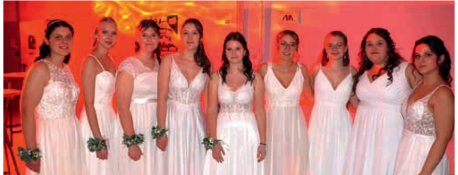
^^ Großartige Stimmung herrschte beim Jubiläumsball zum 80-jährigen Bestehen. Zahlreiche Gäste feierten gemeinsam eine unvergessliche Ballnacht.

Auch bei den Sportwochen des Bezirks zeigte die Landjugend vergangenen Sommer wieder großen Teamgeist, Ehrgeiz und sportliches Können. Mit beeindruckenden 763