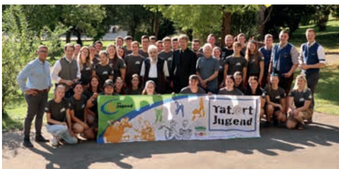
^^ Beim Projektmarathon 2025 stellten die LJ-Mitglieder ihren Teamgeist unter Beweis: Innerhalb von 42,195 Stunden wurden ein Sonnengesangsweg gestaltet, Spielplätze und ein Rundwanderweg neu belebt.