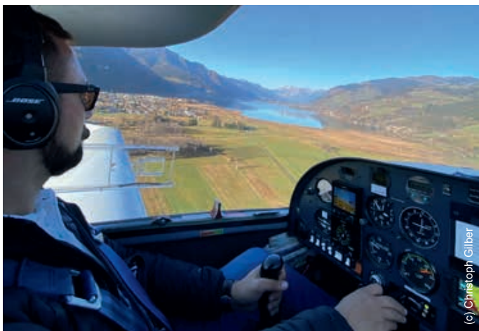
^^ Die USFG St. Georgen setzt auf einen leistbaren Zugang zur Fliegerei und ermöglicht auch EinsteigerInnen den Weg ins Cockpit.

Wer die Faszination Fliegen selbst erleben möchte – sei es im Rahmen einer Pilotenausbildung, bei einem Rundflug über das Mostviertel – kann sich mit seinen Fragen und Anliegen direkt an das Team der USFG St. Georgen am Ybbsfelde wenden: contact@lolg.at