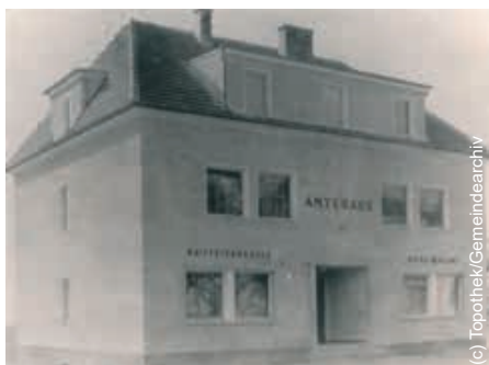
^^ Das organisatorische Zentrum: im 1959 errichteten Amtshaus waren auch die Gendarmerie und die RAIKA untergebracht.

Die verkehrsgünstige Lage von St. Georgen erwies sich als ein wesentlicher Motor der Gemeindeentwicklung. Besonders die Fertigstellung des Autobahnabschnitts zwischen Erlauf und Kottlingburgstall im Jahr 1961 stärkte, gemeinsam mit der Nähe zur Bundesstraße und zur Bahn, die Anbindung an überregionale Verkehrsnetze – ein Standortvorteil, der bis heute von Bedeutung ist. Seit der Bewilligung des Flugplatzes in Leutzmannsdorf im Jahr 1972 zieht die Sportfliegergruppe ihre Runden am Himmel über St. Georgen und Umgebung.