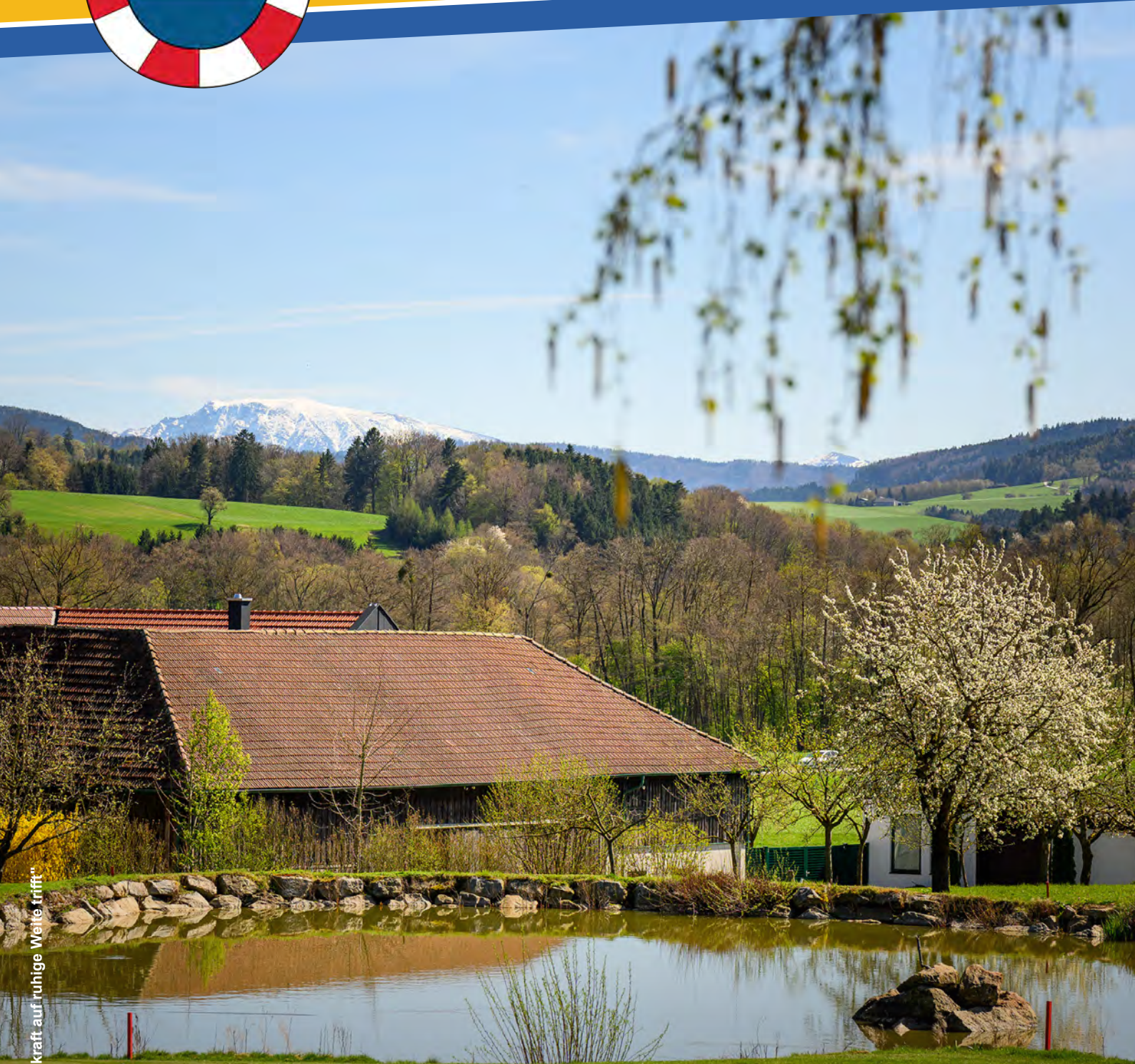
Bildbeschreibung: "Wo Bergkraft auf ruhige Weite trifft"