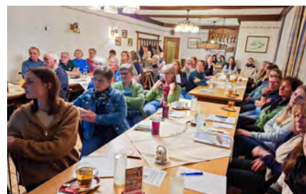
Bild 2: Großes Interesse beim „Natur im Garten“-Vortrag im Gasthof Potzmader

Weitere Informationen und Termine unter Veranstaltungen www.naturimgarten.at