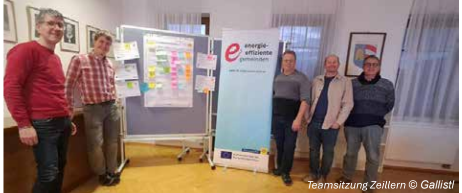
Teamsitzung Zeillern

Gemeinsam wurden Ideen und Maßnahmen gesammelt, wie Zeillern im e5 Programm weiter an Energieeffizienz und Klimaschutz arbeiten kann. Die Projekte wurden zeitlich priorisiert und den Handlungsfeldern des e5-Kriterienkatalogs zugeordnet.