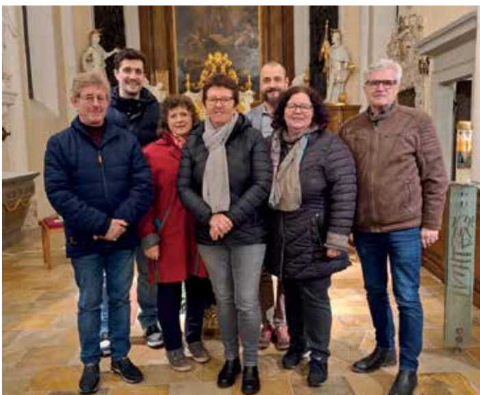
Bericht: Josef Penzendorfer

Zu zukünftigen Friedensgebeten jeweils am ersten Dienstag des Monats (19 Uhr) wird herzlich eingeladen!