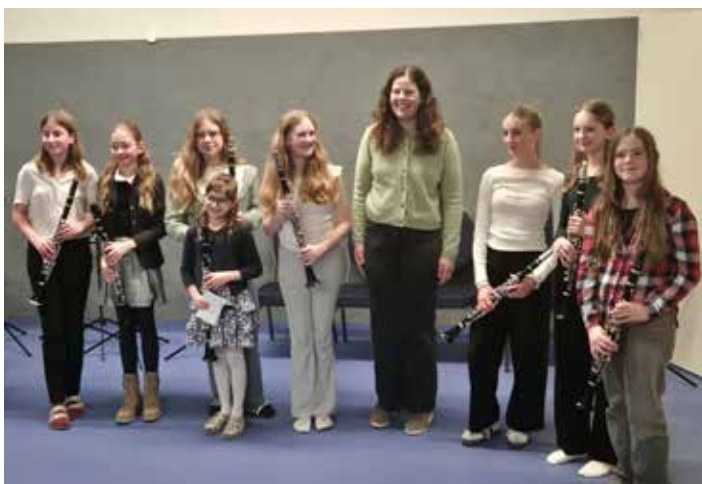
Tolle Vorspielabende von den Kindern der Musikschule