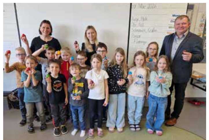
Osterbesuch vom Bürgermeister im Kindergarten und in der Schule (hier 1b VS)