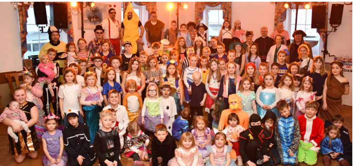
Faschingstreiben in Wolfsbach Spielgruppe „die kleinen Wölfe“ - ÖAMTC Gschnas - ÖVP Kinderfasching