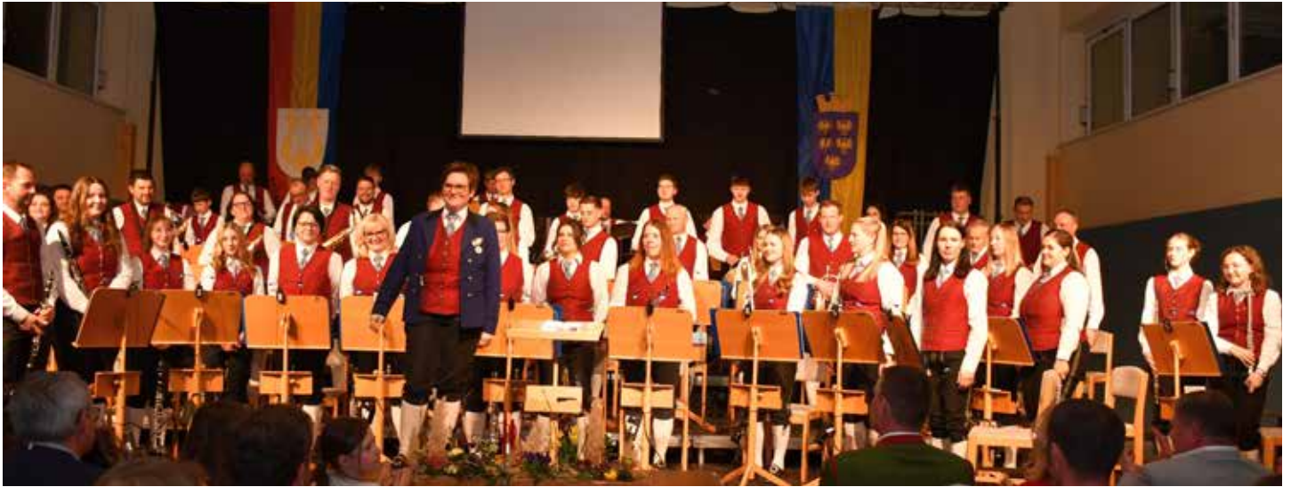
Großartige Frühlingskonzerte unseres Musikvereins