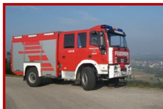
Das bisherige LFA-B wird durch ein modernes HLFA 2 ersetzt.

Ihre Spende ist wiederum steuerlich absetzbar. Geben Sie dazu einfach Name und Geburtsdatum bei der Spende an!