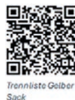
Trennliste Gelber Sack

Für weitere Auskünfte steht Ihnen beim GDA Amstetten zur Verfügung: Abfallberaterin Gudrun Offenberger; offenberger@gda.gv.at 07475/533 40 202