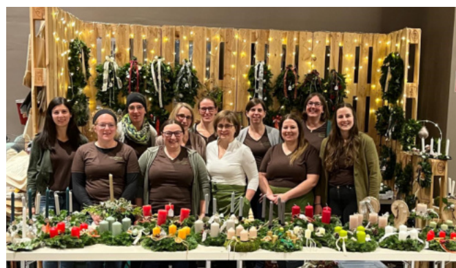
Die Bäuerinnen wünschen allen ein frohes Weihnachtsfest.

Wir wünschen allen Bäuerinnen, Unterstützerinnen und Freunden ein frohes Weihnachtsfest, erholsame Feiertage und einen gelungenen Start ins neue Jahr!