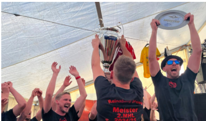
Große Freude herrschte beim Sieg der Meisterschaft in der Melktaler Hobbyliga 2.

Der HC Reinsberg blickt auf ein sehr erfolgreiches Jahr zurück. Bereits im März wurden im Trainingslager in Ritzing (Burgenland) die Weichen für den späteren Gewinn der Meisterschaft in der Melktaler Hobbyliga 2 geschaffen. Dass man gleich mit 28 Personen vor Ort war, darüber staunten auch die im selben Hotel weilenden Sportsfreunde vom SV Ferschnitz nicht schlecht.