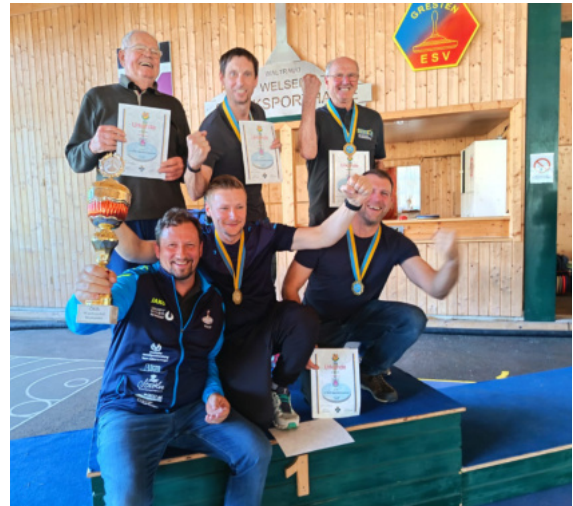
1. Platz beim Mostviertelstockturnier in Gresten

Besonders Stolz sind wir über den 1. Platz beim Mostviertel Stockbewerb .