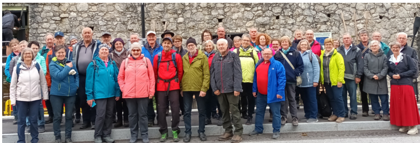
Die Ausflügler auf der Burg Ehrenberg