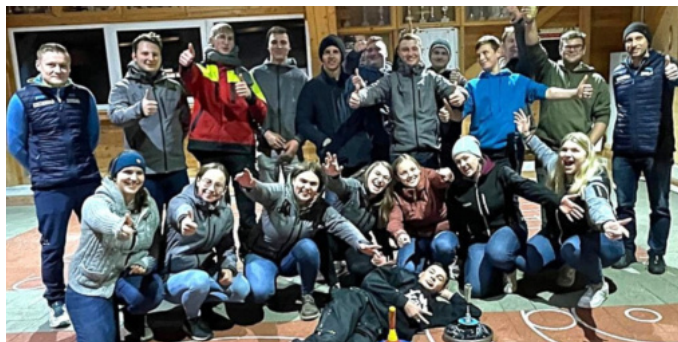
Landjugend und Volkstanzgruppe beim Stockschießen