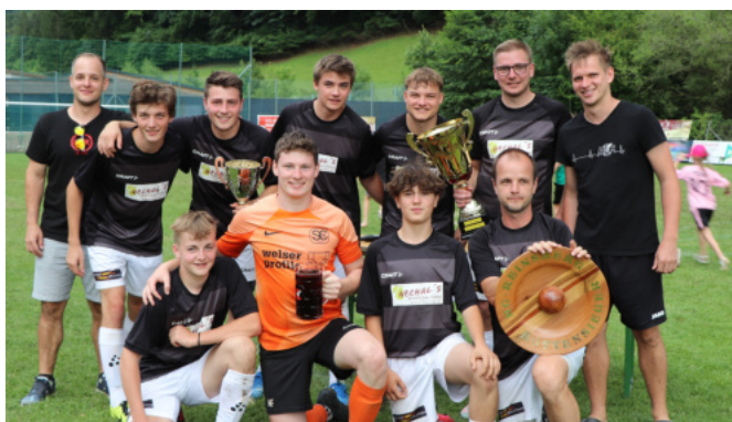
Das Siegerteam Schaittenboden beim Rottenturnier