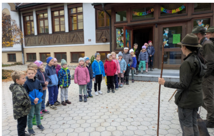
Die Erstklässler sind startklar für den Waldausflug.