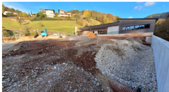
Neuerrichtung der Tennisplatzmauer zum Steinbach

Die Sanierung des Tennisplatzes geht voran und wird in guter Abstimmung mit der Gemeinde ein wichtiger Schritt in die Zukunft, denn unser Motto lautet „WIR BEWEGEN MENSCHEN“.