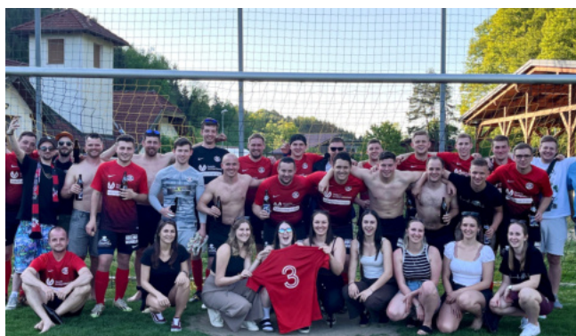
Das Siegerteam des HC Reinsberg beim MFL-Cup

Bestens vorbereitet nahmen wir also die erste Saison in der neu umbenannten Mostviertler Fussball-Liga 1 in Angriff. Mit Erfolg: Dank 10 Punkten in sechs Spielen haben wir uns sofort in den Top 3 der Liga etabliert. Und zwei viel umjubelte Erfolge im MFL-Cup (4:3 gegen Stössing, 2:1 gegen Purgstall) sorgen dafür, dass auch 2026 gleich mit einem Highlight startet: Das erste Pflichtspiel wird somit das MFL-Cup-Halbfinale gegen Randegg sein (vermutlich am SA, 28. März). Ein Leckerbissen für jeden HCR-Fan!