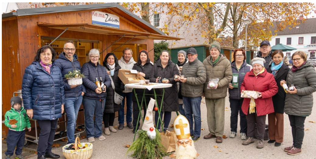
Foto: Bgm. Juliana Günther (li) freut sich mit gGR Ilse Beham (4vl) und Dorferneuerungsvereinsobfrau Iris Schratlbauer (6vl) über das große Interesse der BesucherInnen

Region und hochwertige biologische Produkte. Beim Adventmarkt am 15.11.2025 gab es noch zusätzlich saisonale Produkte zu erwerben. Das „Steh-Café zur alten Tasse“ verwöhnt Sie mit Leckereien und bietet bei einer Tasse gutem Kaffee ganz nach dem Vereinsmotto „Ke.ma.Zaum“ die Möglichkeit zur Kommunikation und zum Austausch untereinander.