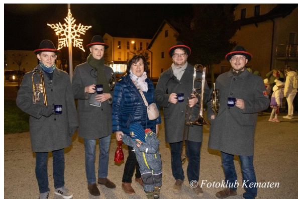
Foto: Stimmungsvolle musikalische Umrahmung durch den Musikverein Hilm-Kematen