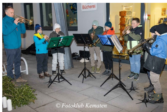
Foto: SchülerInnen des Musikschulverbandes trugen musikalisch zur Adventeinstimmung bei