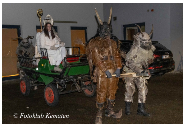
Foto: Der Kematner Adventmarkt bot für Groß und Klein viele Attraktionen - etwa sehenswerte Perchten der Kematner Urteufeln