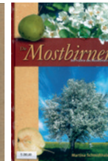
„Die Mostbirnen“ von Martina Schmidthaler 184 Seiten Preis: € 35,00