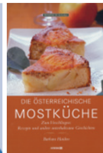
„Die Österreichische Mostküche“ von Barbara Haiden 143 Seiten Preis: € 16,90