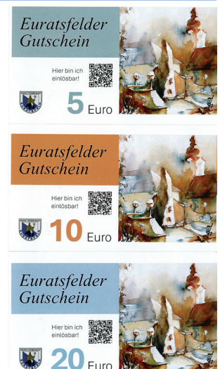
Grafik: Marktgemeinde Euratsfeld

Die Gutscheine können beim Sparmarkt Hahn und bei der Raiffeisenbank Euratsfeld erworben und in sämtlichen Euratsfelder Betrieben eingelöst werden. Die Einkaufsmöglichkeiten sind sehr groß und sollen möglichst viel genutzt werden. Bitte kaufen Sie auch weiterhin Euratsfelder Einkaufsgutscheine und unterstützen Sie die Euratsfelder Wirtschaft.