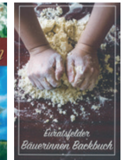
„Euratsfelder Bäuerinnen Backbuch“ von den Euratsfelder Bäuerinnen 191 Seiten Preis: € 15,00