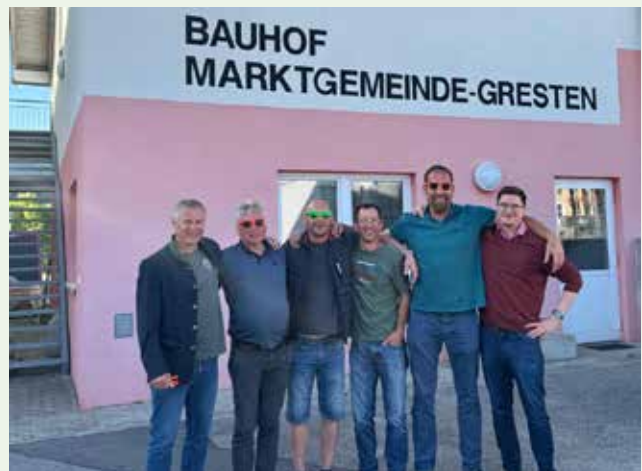
FOTO: Gruppenfoto Außendienst, BGM, AL vor Bauhof

Neben der vielfältigen Themenstellungen gab es für die Marktgemeinde vor allem die Angebote über Kommunalfahrzeuge zu sondieren und neue Lösungen des Winterdienst zu sichern. Dabei wurden Alternativen zur aktuellen Salzstreuung und die modernsten Kommunalfahrzeuge besichtigt und die Vor- und Nachteile im Detail diskutiert.