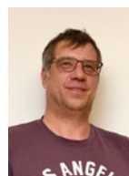
Adolf Leutgeb (Freiheitliche Partei Österr.)