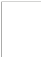
Mandat unbesetzt (Freiheitliche Partei Österr.)