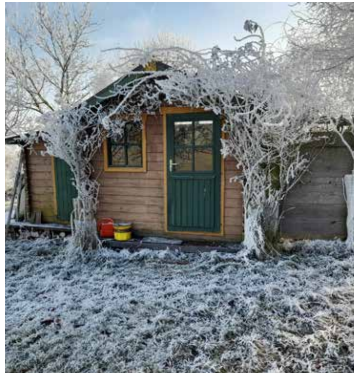
Bienenhütte im Rauheif

vom Imker und der Imkerin in ihrer Nähe, eben dem Imker und der Imkerin ihres Vertrauens!