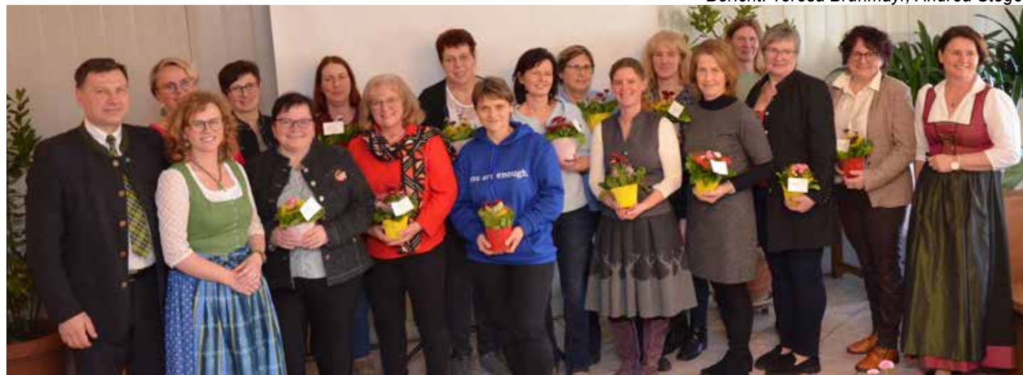
Ehrungen für die ausgeschiedenen Funktionärinnen

Ende Januar eröffnete der Verein „Die Bäuerinnen“ das neue Jahr traditionell mit dem „Tag der Bäuerin“ des Gebietes St. Peter/Au, der dieses Mal in Wolfsbach stattfand. Nach einer feierlichen Messe, musikalisch umrahmt vom Bäuerinnenchor „Herz Mostviertel“, fanden sich die Damen mit zahlreichen Ehrengästen im Gasthaus Karan ein, um gemeinsam zu feiern und sich auszutauschen.