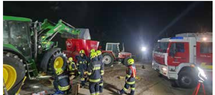
Bericht: Matthias Witzlinger

Vielen Dank an Alle, die sich der Herausforderung stellen eine realistische Übung nachzustellen und auch für abwechslungsreiche Übungen sorgen.