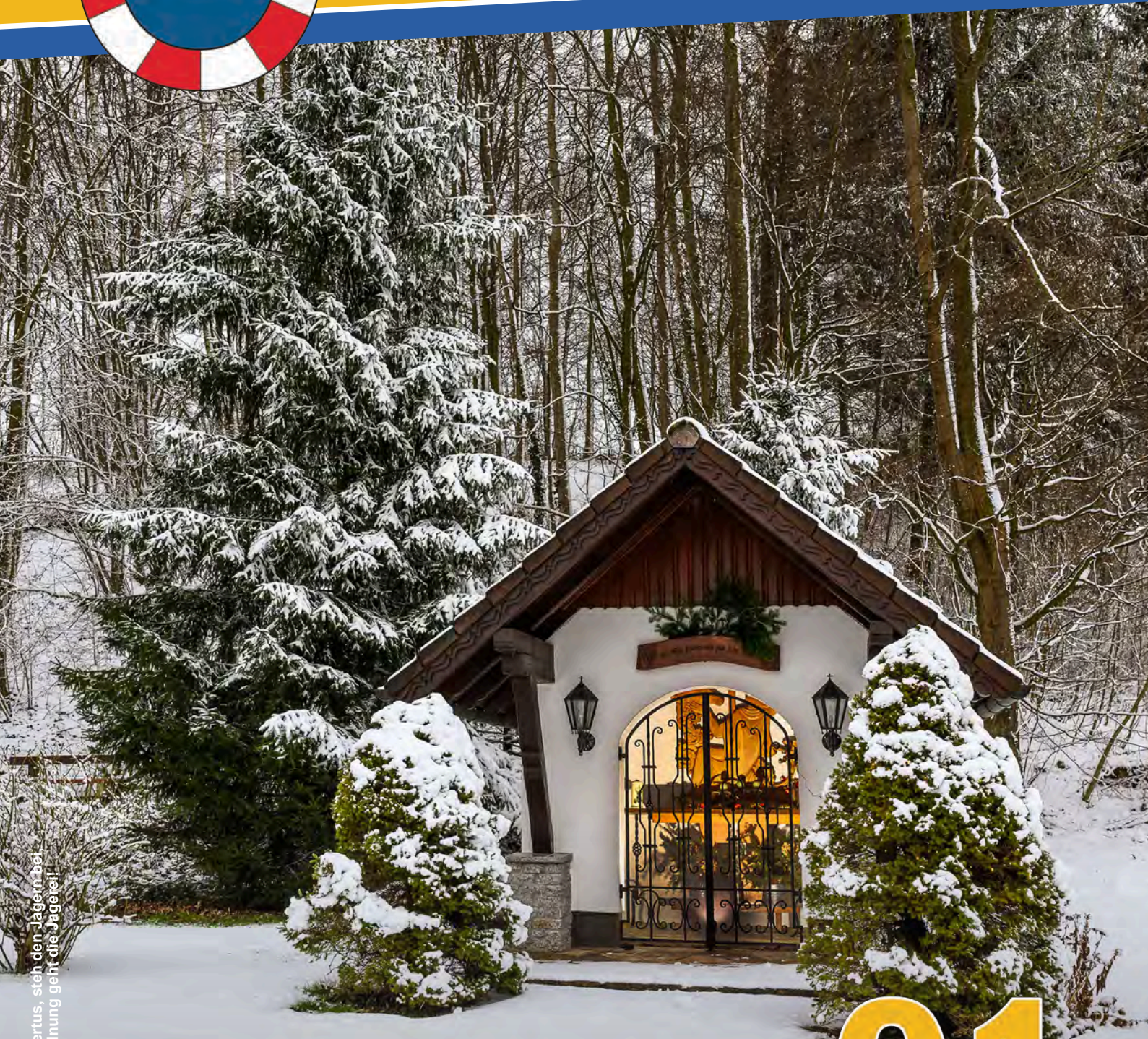
Bildbeschreibung: „Sankt Hubertus, steh den Jägern bei, dass in Ordnung geht die Jagerei!“