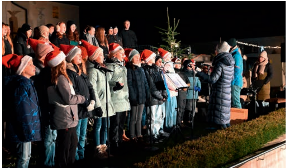
Die Schüler der ersten und vierten Klasse der Musikschule Blindenmarkt.

Zum krönenden Abschluss fand am zweiten Adventwochenende zum dritten Mal in Folge die beliebte „DaBasGo -Punschparty“ statt. Auch in diesem Jahr sorgte das karitative Projekt abermals für Begeisterung und lockte jede Menge Besucher in den Georgsaal. Die Idee für das Benefizkonzert stammte von den „DaBasGo“-Bandmitgliedern selbst, welche mit ihrer Benefizveranstaltung das Jahr ganz besonders ausklingen lassen wollten.