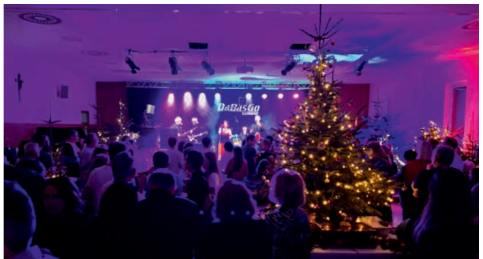
Freier Eintritt bei der DaBasGo's Punschparty: der Erlös dient einem karitativen Zweck.

Mit den gesammelten Spendengeldern und dem übrigen Gewinn aus