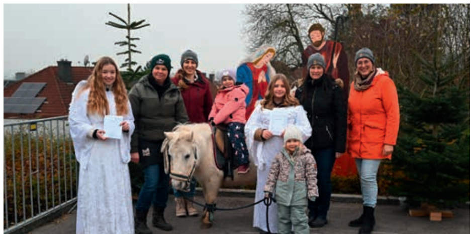
Die Projektgruppe Christkindlmarkt bedankt sich recht herzlich bei allen freiwilligen Helfern, die beim diesjährigen Christkindlmarkt mitgewirkt haben.