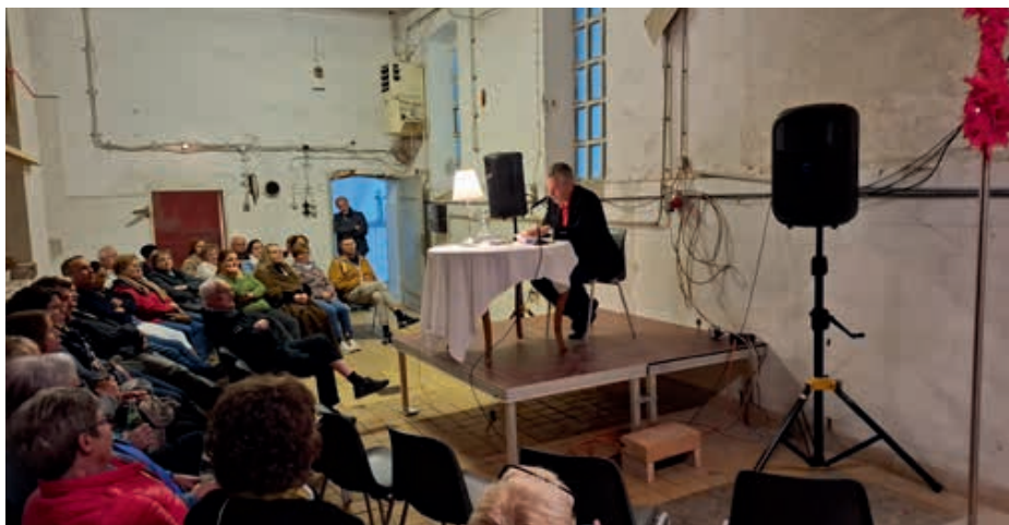
Krimi-Vorlesung: Die Räumlichkeiten der alten Molkerei sorgten für Gänsehautstimmung.

Im Georgsaal sorgte die Aufführung der Geschichte des „Grüffelos“ für strahlende Kinderaugen. Die Dar-