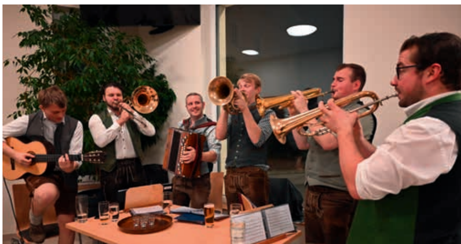
Die Musikgruppe „Hausverstand“ sorgte im Georgsaal für reichlich Stimmung.