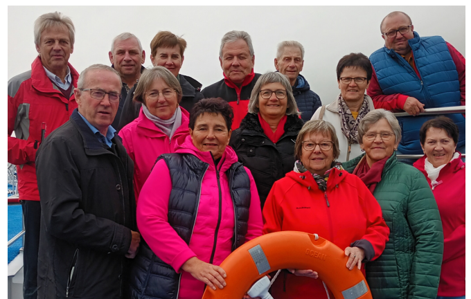
„Schiff ahoi!“ Unterwegs auf Rhein und Mosel

Entlang des Rhein und der Mosel fanden wir viele Weingärten, und immer wieder historische Bauten, die zum Unesco-Weltkulturerbe erhoben wurden.