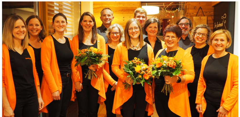
Der neue Vorstand von inwendig woarm