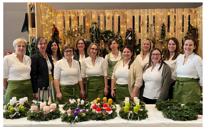
Beim Adventmarkt konnten wir uns in unserem neuen Gewand präsentieren.

Der Adventmarkt im Musium mit unseren bäuerlichen Produkten, Gestecken und Mehlspeisen war wieder ein voller Erfolg.