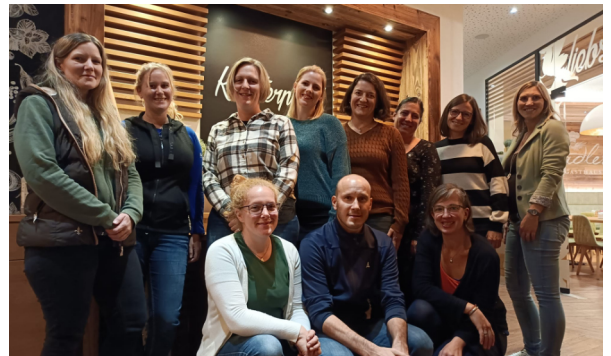
Der neue Vorstand

In den nächsten beiden Jahren wird der Elternverein viele Vorhaben und Exkursionen während des Schuljahres finanziell unterstützen und bei Veranstaltungen mithelfen. Möglich wird dies durch das Organisieren von Veranstaltungen wie „Kindefasching“ und der „Osterjause“ am Palmsonntag.