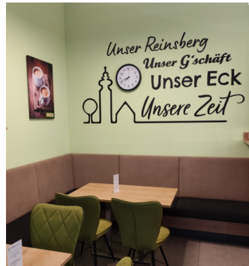
Unser G'schäft in Reinsberg mit dem gemütlichen Café „Unser Eck“

Am 1. Oktober 2024 wurde dem Verein Unser G'schäft in Reinsberg von Landeshauptfrau Johanna Mikl-Leitner im Rahmen eines Festaktes in St. Pölten der ethos.award für besonderes regionales Engagement überreicht. Wir wurden von einer unabhängigen Jury aus 69 Mitbewerbern ausgewählt.