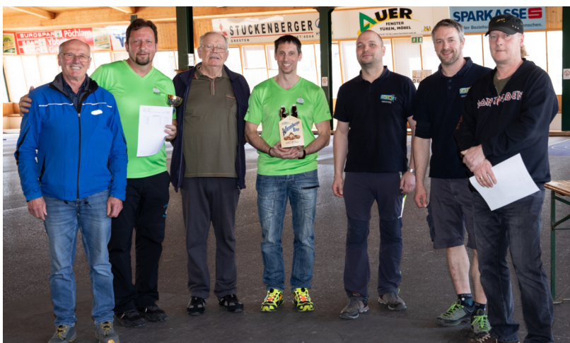
3. Platz beim HB Stockfurnier in Gresten