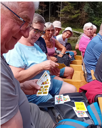
Im Sommer ging es in die Hohe Tatra.

12 ReinsbergerInnen schifften in Mainz in die "Aurora" ein, um einige wunderschöne Tage auf dem Rhein und der Mo-