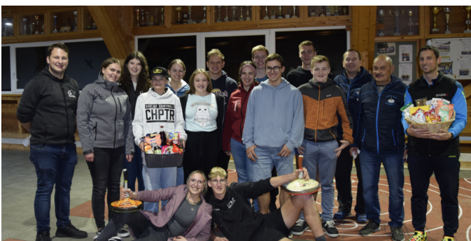
Landjugend und Volkstanzgruppe beim Stockschießen

Heuer fand das vereinsinterne Turnier der Landjugend und Volkstanzgruppe Reinsberg ausnahmsweise am 27. Oktober statt. Aufgeteilt auf 4 Mannschaften wurde ein Turnier gespielt, wobei die Geselligkeit und der Zusammenhalt im Vordergrund standen. Voller Begeisterung wurde Kehre für Kehre gemeistert und es war uns eine Freude, ihnen zuzusehen und sie mit den Regeln des Stocksports vertraut zu machen.