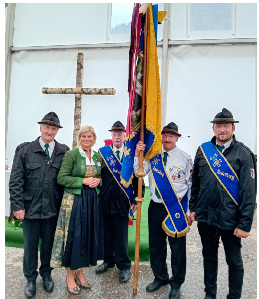
HB Treffen in Lassing mit Verteidigungsministerin Claudia Tanner

Das Zimmergewehrschießen in Reinsberg ist schon Tradition und eine gut angenommene Bereicherung beim Dorffest.