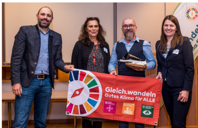
Präsentation des Filmes im Rahmen der Versammlung der Klimabündnis Gemeinden in Obergrafendorf am 7. November 2024.

https://gleichwandeln.at/reinsberg-ortskernkultur/