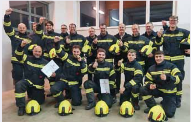
Foto v.l.n.r.: Die erfolgreichen Teilnehmer der Feuerwehr Ardagger Markt bei der Ausbildungsprüfung.