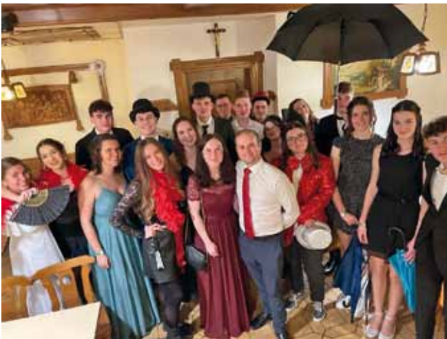
Foto: Die Jugendlichen der JVP Kollmitzberg beim Jugendball Ende November.