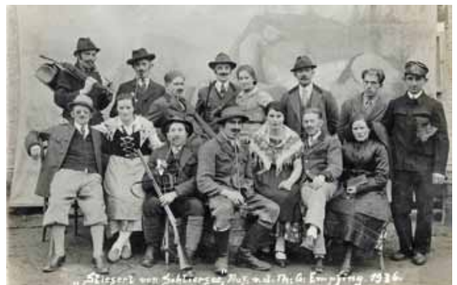
Foto: Theatergruppe Empfing 1936.