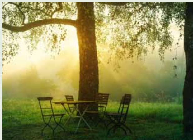
Foto: Schattenplätze unter Bäumen sind besonders im Sommer ein Lieblingsplatz.

Vielleicht auch für sie ein Ziel im kommenden Jahr.