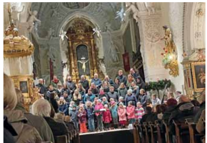
Foto: Wunderbares Konzert in der Stiftskirche.

lische Note sorgte diesmal die Stifta Geigenmusik, die nach 40 Jahren Zusammenspiel so schön anzuhören ist, wie am ersten Tag. Die Idee, den Ausklang anschließend - auch musikalisch begleitet - noch in den Kreuzgang zu verlegen, fand großen Anklang und brachte nicht nur viel Lob sondern auch wertvollen Austausch zwischen den Gästen. Ein gelungener vorweihnachtlicher Nachmittag und Abend.