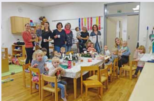
Foto unten: Die Kinder des Zwergelgartens und der Kleinkindgruppe mit den Pädagoginnen, Betreuerinnen, Mamas und Omas beim Adventkranzbinden.