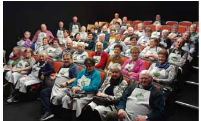
Foto: Die Kollmitzberger Senioren beim Ausflug im Haubiversum.

Programm standen. Ein weiteres Highlight war der Besuch von „Großmutter's Stübchen“ in Mühling, mit seinem nostalgischem Charme. Einen gemütlichen Abschluss gab's dann bei einem Einkehrschwung beim Heurigen in Perbersdorf. Danke an die Organisatoren für den gelungenen Tag!