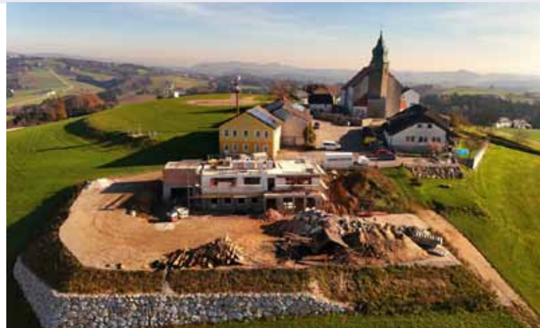
Foto: Baustelle Pfarrhof Kollmitzberg.