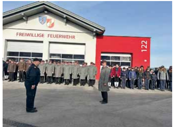
Foto: Inspizierung bei der FF Stefanshart.

Am Sonntagvormittag, dem 11.11.2024, stand die Inspektion der FF Kollmitzberg auf dem Programm. Dabei wurden die Funktionsweise von Feuerlöschern, der Umgang mit Schaummitteln und die Maßnahmen bei Schadstoffeinsätzen praxisnah vermittelt. Die FF Kollmitzberg hat die