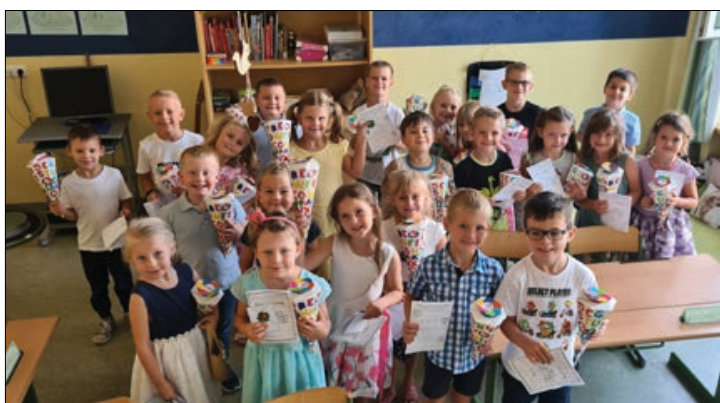
Herzlich begrüßen wir unsere 23 Taferlklasslerinnen und Taferlklassler.

Am 6. September fand die jährliche Evakuierungsübung mit den drei Feuerwehren der Gemeinde statt. Die Feuerwehrfrauen und -männer haben uns wieder sehr professionell bewiesen, dass sie im Notfall alle Personen aus dem Schul-