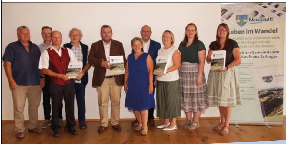
Im Bild der verantwortliche Arbeitskreis "Zeitreise" für die Neustadtler Geschichte und Häuserchronik.

Verkaufsstart der 767 Seiten starken Geschichte und Häuserchronik der Marktgemeinde Neustadtl an der Donau "Leben im Wandel" fanden am Kirtagssonntag, den 28. Juli 2024, statt. Zahlreiche Exemplare wurden schon verkauft und sind bereits vergriffen. Erhältlich ist das Werk im Kaufhaus Zeilinger und im Gemeindeamt. Übrigens ist dieses Buch als Weihnachtsgeschenk für die Angehörigen ein heißer Tipp!