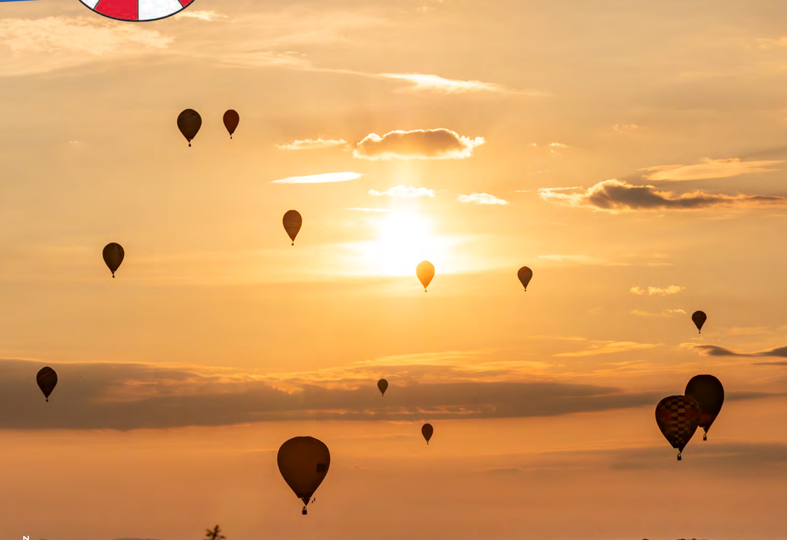
Bildbeschreibung: Ballon Meisterschaften über Ferschnitz