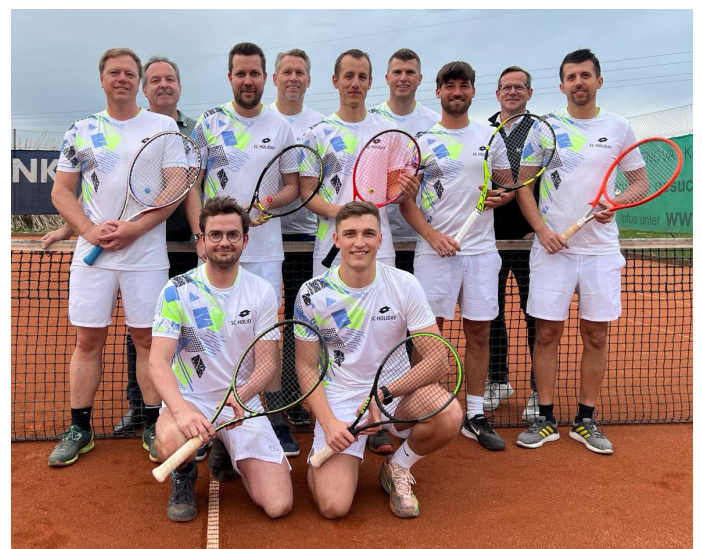
Text und Foto: SC Holiday