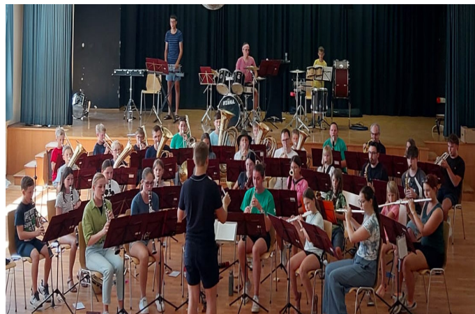
Fotos: MV Erla; Text: Michael Salfer, Jugendreferent Stadtkapelle St. Valentin