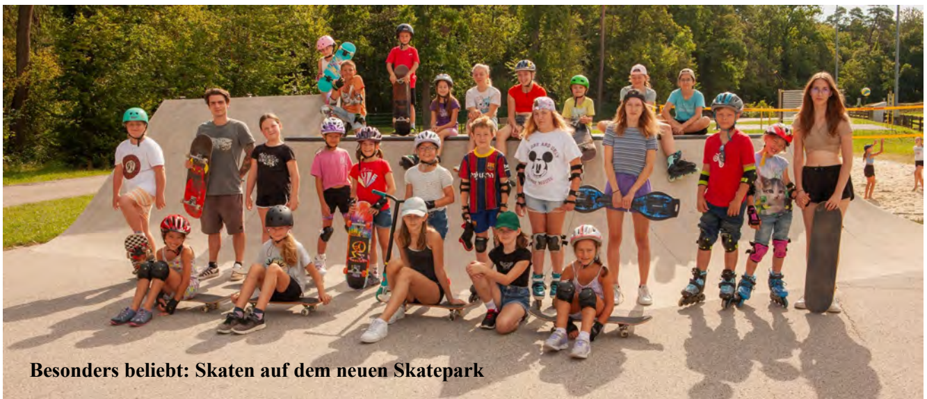
Besonders beliebt: Skaten auf dem neuen Skatepark

Die Marktgemeinde Kematen/Ybbs bedankt sich bei allen Sponsoren, bei allen mitwirkenden Vereinen, dem Aktiv Pferdestall Fam. Tauer-Schuller sowie allen, die zum Gelingen dieser Veranstaltung beigetragen haben!