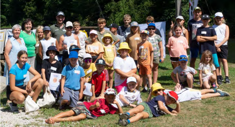
Foto: 37 motivierte Kinder zwischen 6 und 14 Jahren konnten einige Forellen und Barben fangen. Je ein Angelset gewannen ein Mädel und ein Bursch mit dem größten Fisch. Für jedes Kind gab es ein Sackerl voller Geschenke und die Chance bei der Tombola weitere tolle Preise unserer Sponsoren zu gewinnen

fischen vom Verein Ybbs-Leben, der auch das Fischereirevier Ybbs BI/3 betreut und dieses naturnah als Erholungsoase erhalten will. Für das leibliche Wohl aller war durch ein abschließendes Grillen bestens gesorgt. Der Verein Ybbs-Leben bedankt sich herzlich bei allen Helfern, Sponsoren und der Gemeinde Kematen.