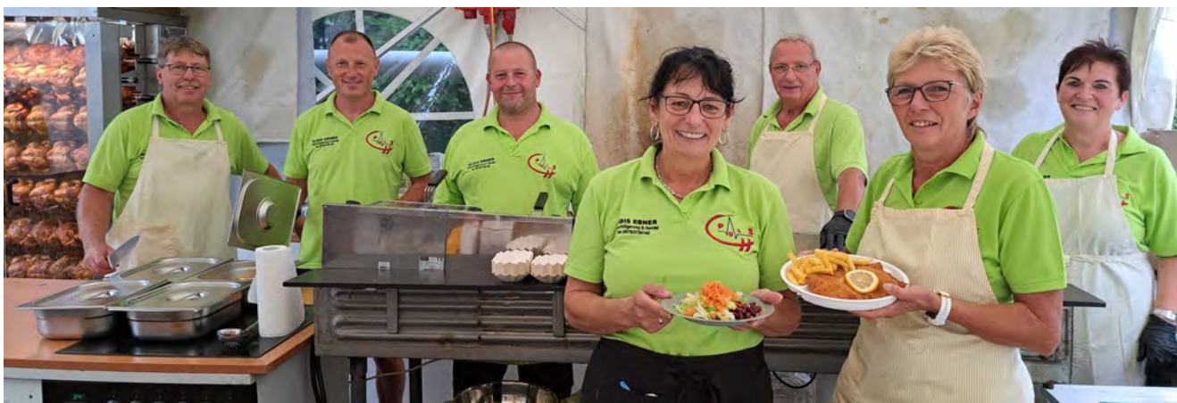
Foto: Das engagierte Küchenteam bereitete Grillhendl und viele andere Köstlichkeiten zu