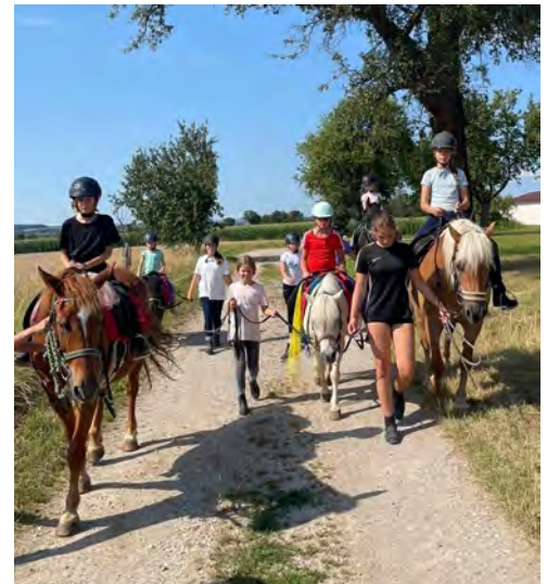
Reiten zählt jedes Jahr zu den besonderen Attraktionen