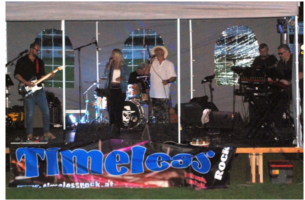
Foto: Die Gruppe Timless Rock sorgte mit tollem Rock'n Roll Songs für beste Stimmung