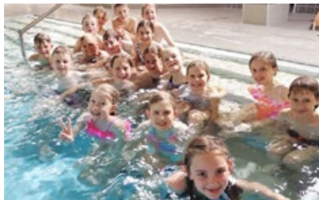
Das Tolle: jedes Kind schaffte einen Schwimmausweis!

Mitte Mai erlebten die dritten Klassen besondere Tage. Sie fuhren ins Familienbad Oberndorf. Dort lernten die Kinder Schwimmtechniken, Tauchen eines schweren Gegenstandes, Kopfsprung uvm. Besonders das 15-minütige Dauerschwimmen machte sie am Ende der Woche etwas müde.