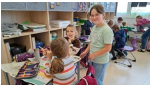
Die „Großen“ lasen den „Kleinen“ vor.

Am 24. Mai besuchten die Schulanfänger unsere 2. Klassen im Rahmen eines Leseprojektes. Eine ganze Stunde beschäftigten sich die Kinder mit dem Kinderbuch „Elmar“. Zuerst wurde den Kindern das Buch vorgelesen und im Anschluss bastelten und gestalteten die Schulanfänger mit Hilfe der Schulkinder ihren eignen Elmar. Zum Abschluss wurde noch ein gemeinsames Lied gesungen, bevor sich die Kindergartenkinder wieder auf den Weg nach Hause machten.