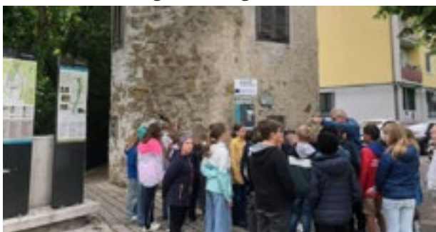
Der Purgstaller Turm überdauert schon Jahrhunderte.

Am Freitag, den 17. Mai fuhren die 4. Klassen mit Hr. Grimm auf Bezirksrundfahrt. Nach dem Besuch der Kirche in Wieselburg und einer Wanderung entlang der Ringmauer in Purgstall zeigte Hr. Grimm den SchülerInnen die ehemalige Gerberei. Im Töpperpark in Scheibbs wurde kurz gejausnet und anschließend die Bezirkshauptmannschaft im Schloss besucht. Dort konnten die Kinder im Sitzungssaal Platz nehmen. Zum Abschluss der Runde wurde die Kartause Gaming besichtigt.