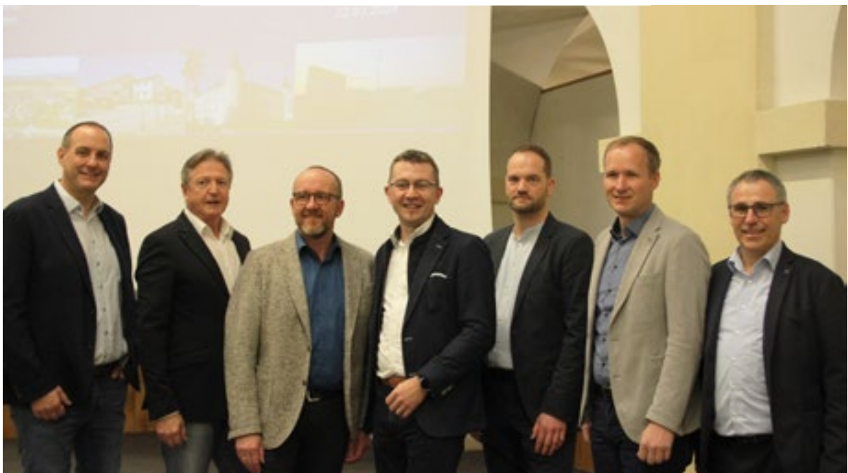
Der Vorstand der neugegründeten Erneuerbaren Energiegemeinschaft „Energiezukunft Wolfpassing“