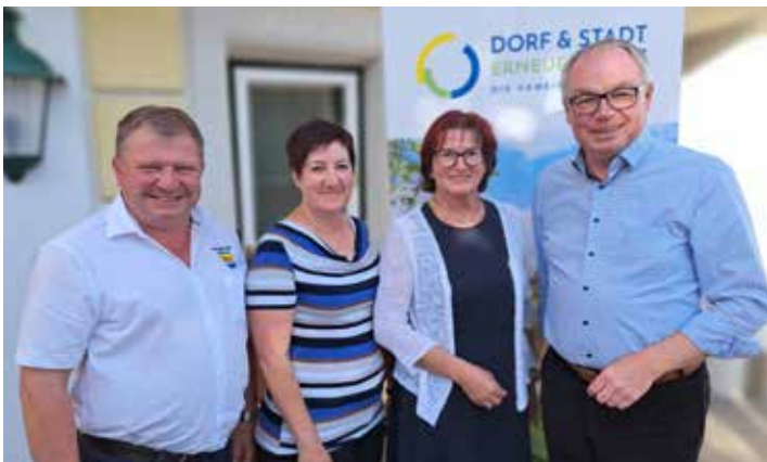
„Vernetzungstreffen“ mit LH-Stv. Pernkopf