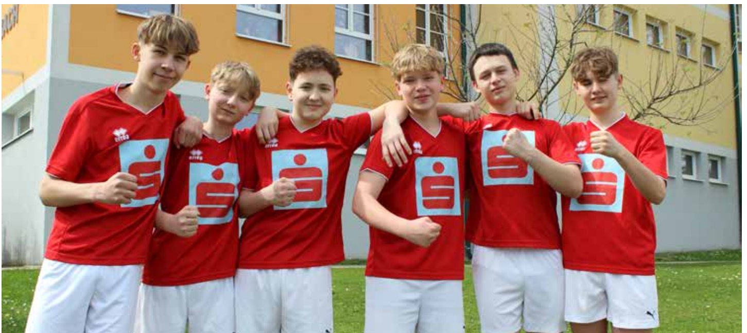
Landesmeister Geräteturnen Turn10