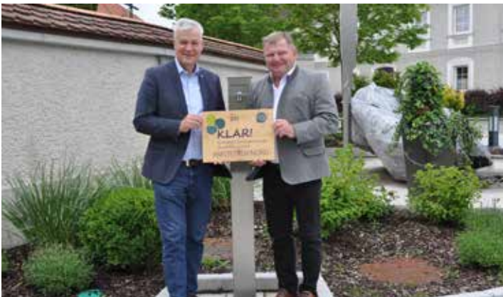
Förderung für den Trinkbrunnen am Marktplatz