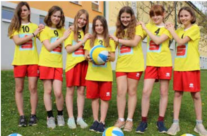
Bezirkssieger Rookie Cup Volleyball