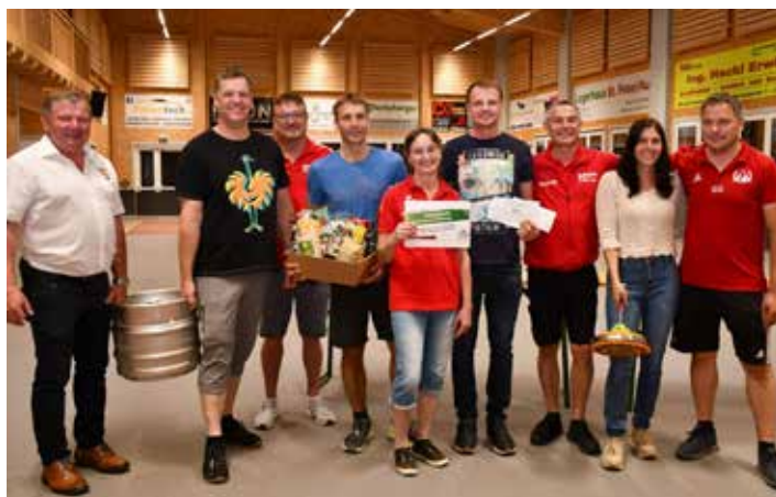
Ortsmeister 2024: Bauernbund