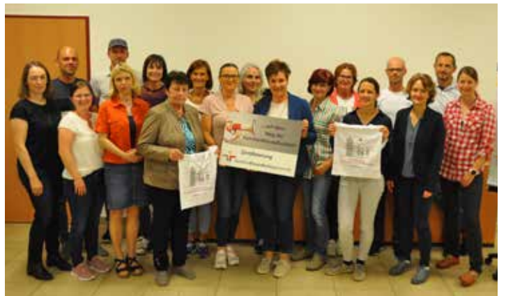
Foto: Teilnehmer und Teilnehmerinnen des IST-Workshops

Eine Maßnahmenliste und konkrete Projekte für die Umsetzung werden in Folge im Soll-Workshop im Herbst erarbeitet.