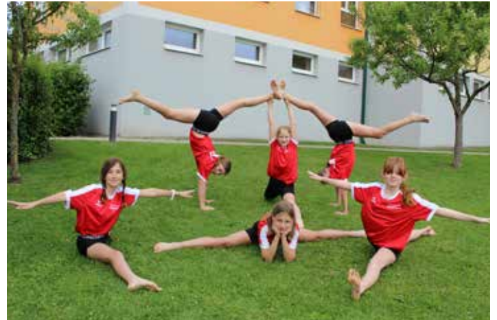
Vizelandesmeisterinnen im Geräteturnen Turn10