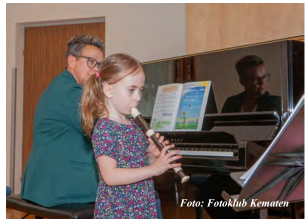
Foto: musikalische Umrahmung durch den Musikschulverband Region Sonntagberg