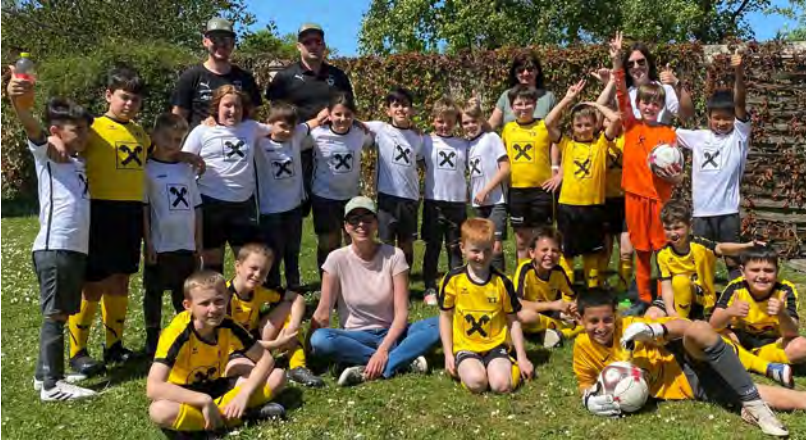
Foto: Die Kinder und das Betreuer-team hatten sichtlich großen Spaß am Wettbewerb