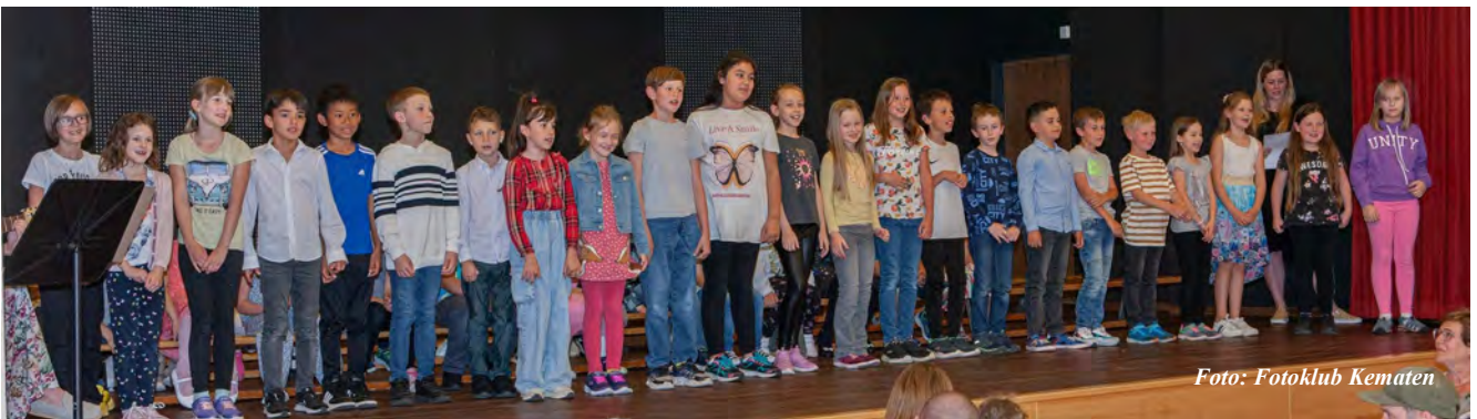
Foto: gekonnte Darbietung der Volksschüler