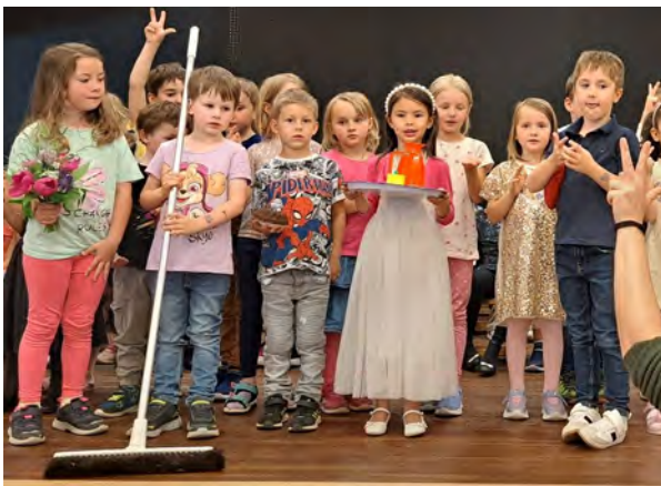
Foto: die Kindergartenkinder begeisterten mit ihrer Vorführung