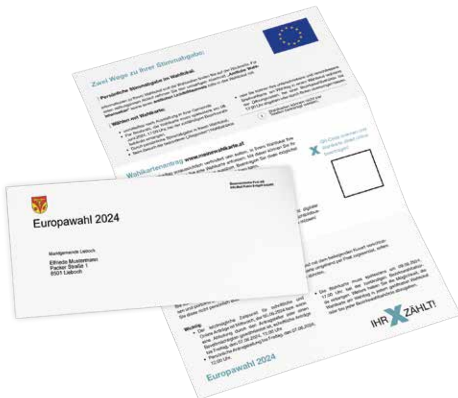
VERWENDEN SIE BITTE FÜR WAHLKARTENANTRÄGE DIESE AMTLICHE WAHLINFORMATION! – SIE ERLEICHTERN UNS WESENTLICH DIE ARBEIT

Zur Erleichterung der Wahlabwicklung bringen Sie den personalisierten