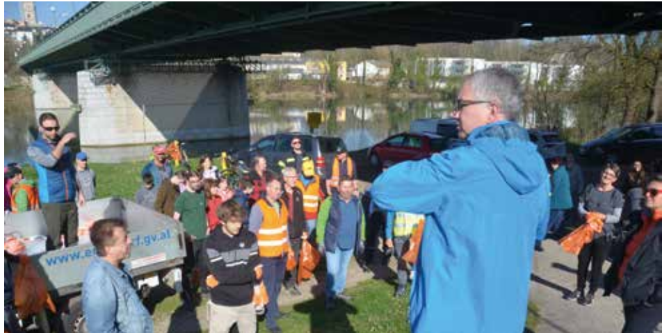
Treffpunkt war wie üblich um 09.00 Uhr bei der Ennsbrücke.

Zur Stärkung und als Dankeschön gab es im Anschluss einen Imbiss im Gasthof Stöckler/Familie Spitzer für alle, die dabei waren!