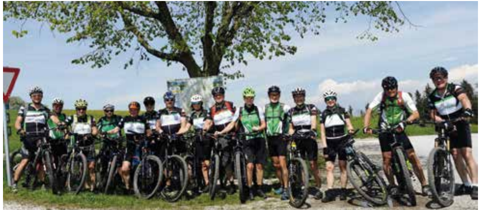
Auch Anfänger und Einsteiger sind jederzeit willkommen.

Die Rennradgruppe trifft sich jeden Montag um 18:00 Uhr und die Mountainbiker jeden Donnerstag um 18:00 Uhr am hinteren BillaPlus-Parkplatz. Gefahren wird bis zum Einbruch der Dunkelheit. Es gibt mehrere Leistungsgruppen. Anfänger und Einsteiger sind sowohl bei den Rennradlern als auch bei den Mountainbikern jederzeit herzlich willkommen.