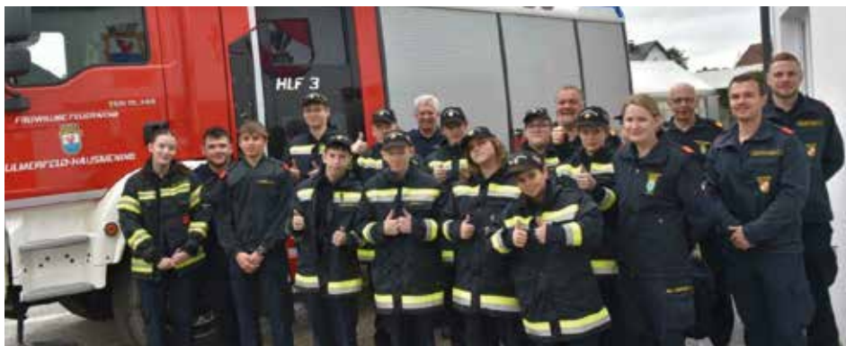
Die Feuerwehrjugend Ennsdorf absolvierte den Wissenstest erfolgreich.