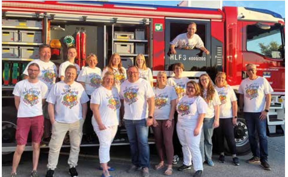
Das Ferienspaß Team 2024 freut sich auf einen abwechslungsreichen Sommer.

der Online auf der Gemeindehomepage erfolgen. Diese ist ab dem 21. Juni 2024 freigeschaltet.