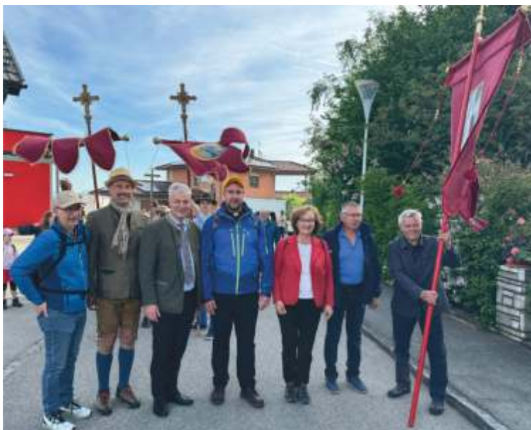
Foto: Wallfahrer Neuhofen