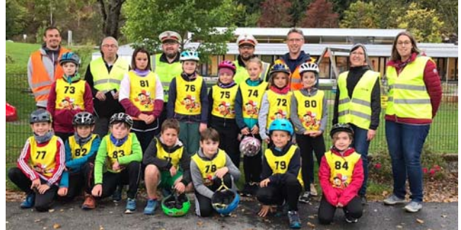
Gruppenfoto nach der erfolgreichen Prüfung

Herzlichen Dank auch an die RAIBA Lunz für die Übernahme der Kosten für die Radausweise (in Zusammenarbeit mit unserem Elternverein ) und für die Startnummern!