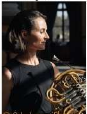
© Odeslano z iPhonu Katerina Javurkova