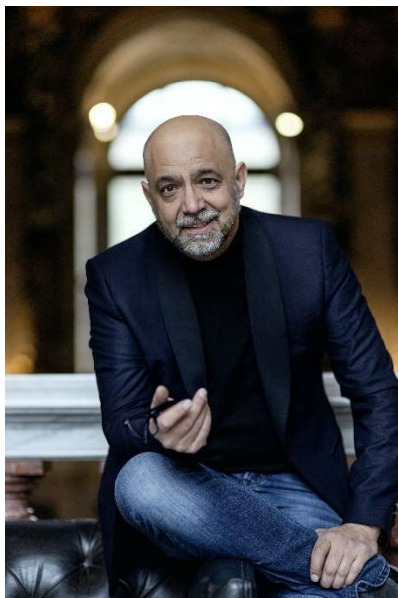
Walter Vogelweider, Foto: zVg

Unsere Produktion brachte es auf 42 Vorstellungen in Blindenmarkt, Wien und Burgenland. Fast 21.000 BesucherInnen verfolgten diese sensationelle Produktion. Gigantisch! Wir gratulieren unserem fantastischen Team und Ensemble.