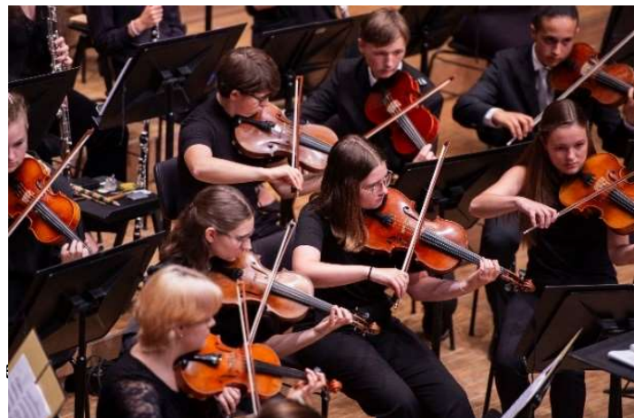
Jugendsinfonieorchester NÖ

Schulvorstellungen FRAU HOLLE gerhard.wagner@herbsttage.at