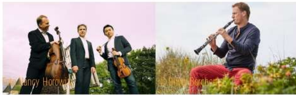
Altenberg Trio Wien