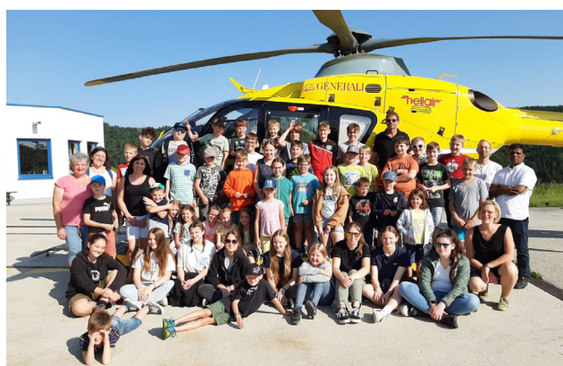
Ministrantenausflug zum Christophorus 15