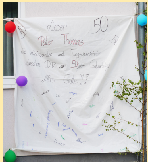
Die Pfarre Reinsberg und die Jungscharkinder gratulieren mit einem Banner zum 50er!