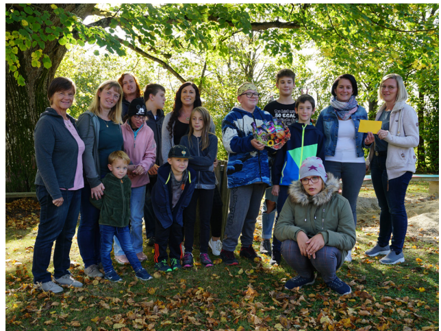
Spendenübergabe KFB Benefizkaffee Erntedank