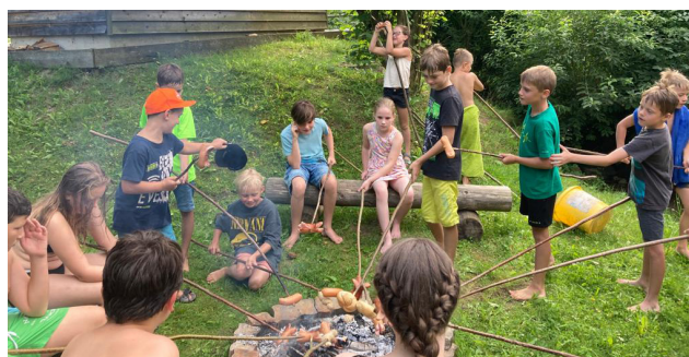
Bade- und Grillnachmittag