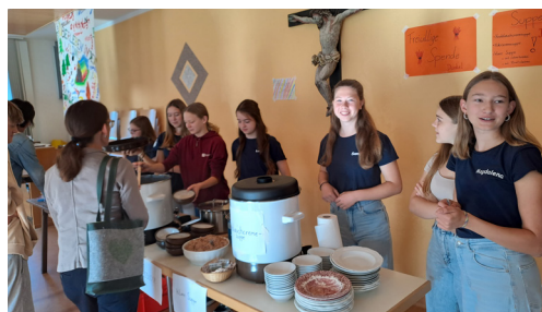
Jungschar isst Suppe´r