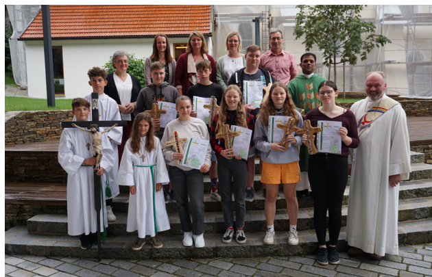
Verabschiedung der Ministranten am 3. September

24 Teilnehmer von insgesamt 182 Spielern kamen aus Reinsberg. Die Großen (3. und 4. NMS) erkämpften sich Platz 1 – herzliche Gratulation! 1. und 2. NMS erzielte Platz 3 , die beiden Gruppen der 3. und 4. Volksschule nahmen Platz 5 und Platz 6 ihrer Altersklasse ein.