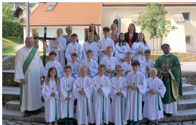
Aufnahme der Ministranten am 25. Juni