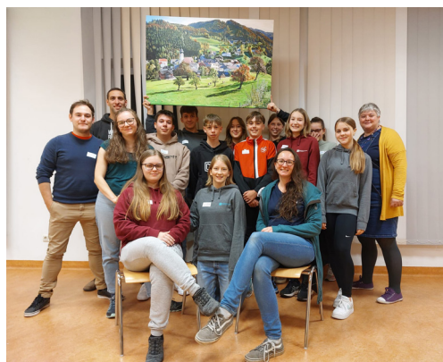
REMIX im Pfarrheim