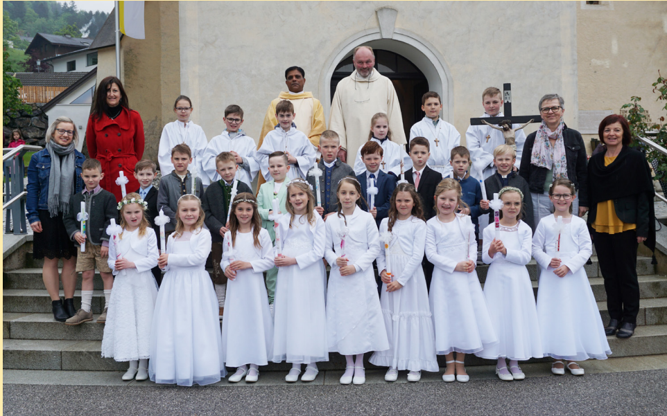
Reinsberger Erstkommunion- kinder 2023