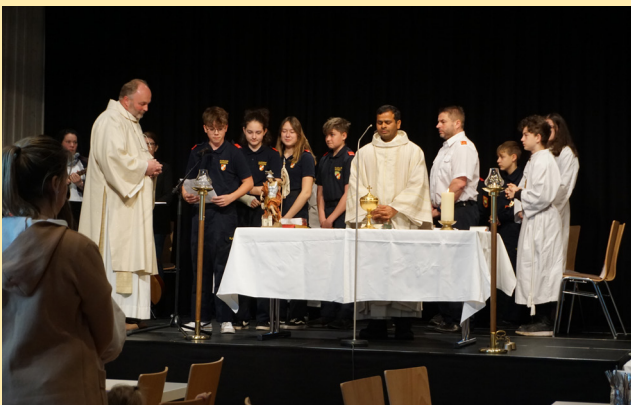
Hl. Messe beim Feuerwehrheiligen am 16. April 2023