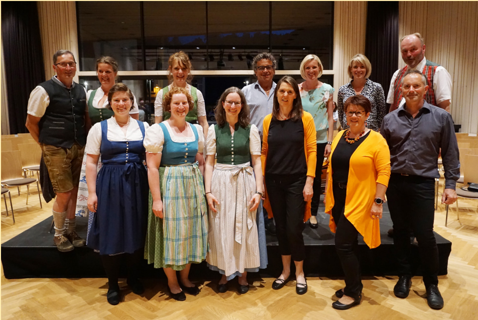
Benefizkonzert „Wo man singt, da lass dich ruhig nieder“ am 28. Mai 2023 im Musium mit der „Rundumzianabergmusi“, „Harmoni/:a:\rtists“, „Dreimäderlhaus“ und „inwendig woarm“.