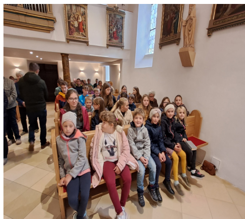
Weltmissionssonntag- Messe mit den Kindern