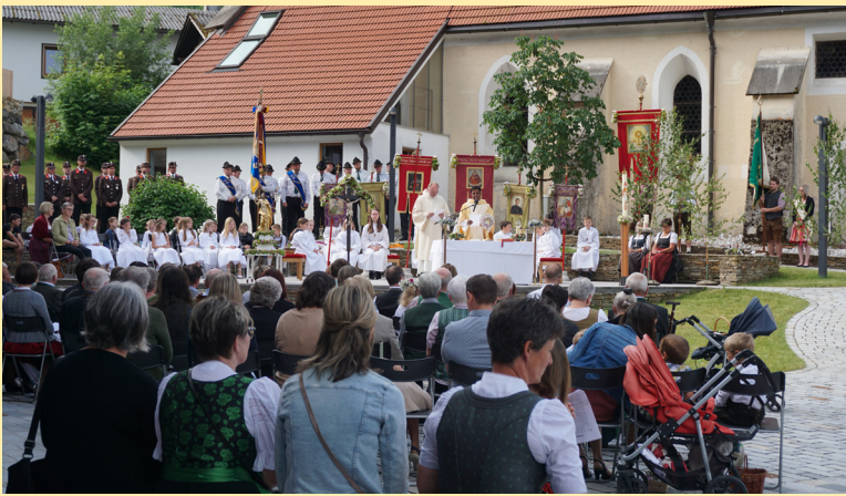
Fronleichnam, 8. Juni 2023 am Dorfplatz