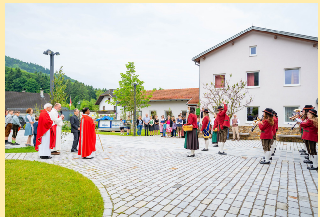
Firmung in Reinsberg