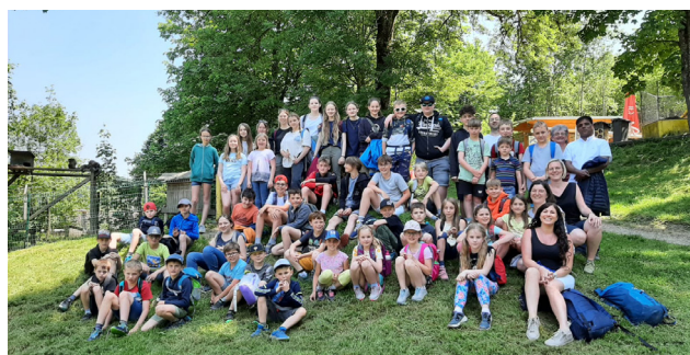
Ministrantenausflug beim Tierpark Buchenberg