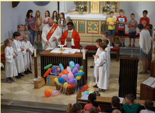
Schulabschlussgottesdienst, 29. Juni 2023