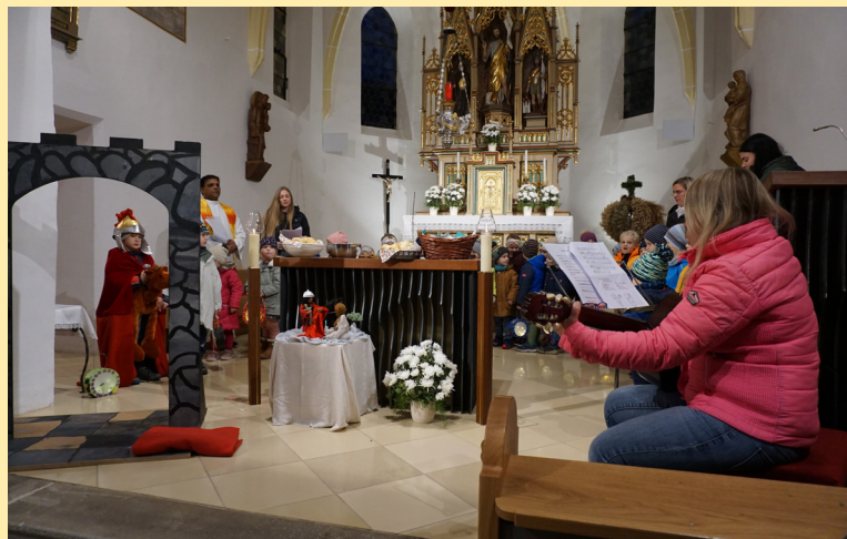
Martinsfest, 13. November 2023