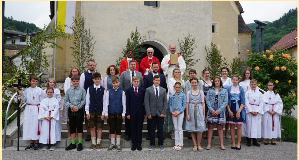
Reinsberger Firmlinge 2023