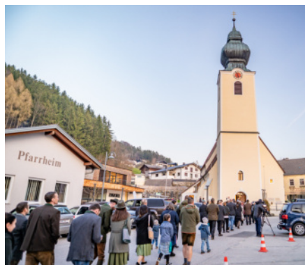
Wallfahrt der Mostbarone von der Schnalle zur Pfarrkirche, in der eine Dankmesse gefeiert wurde.