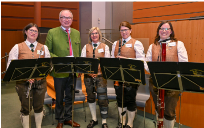
Die Flötistinnen des Flögonett gestalten den musikalischen Rahmen.