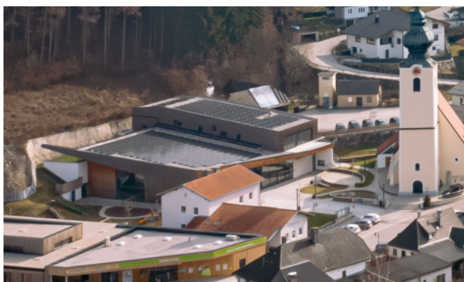
Die neue PV-Anlage am Dach des MUSIUMs lieferte uns im Februar 3,90 MWh Strom.

Die ersten Zahlen (Februar 2024): Energieertrag: 3,90 MWh Verbrauch 5,27 MWh Eigenverbrauch: 1,58 MWh Netzeinspeisung: 2,32 MWh