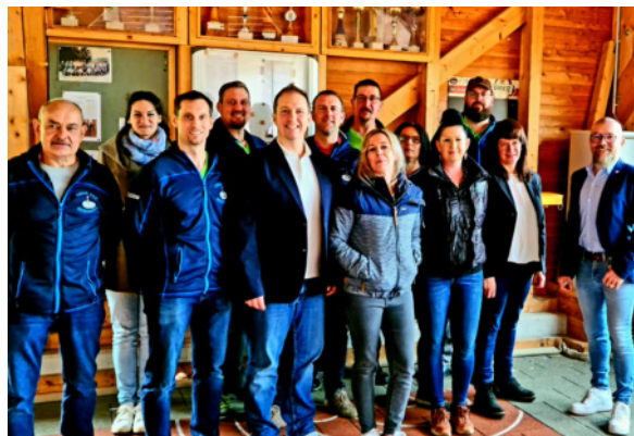
ESV Reinsberg Neuwahlen

Wir freuen uns über alle, die das Stockschießen einmal ausprobieren möchten!!