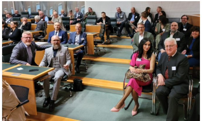
Die Delegation aus Reinsberg bei der feierlichen Preisverleihung im Landtagssitzungssaal.