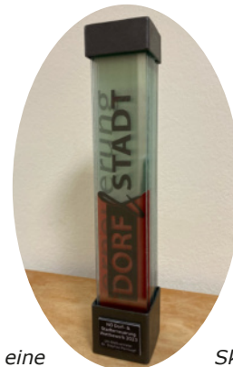
Der Preis ist eine Skulptur aus Glas. Das Kunstwerk wurde von Sabine Funk-Müller entworfen und nimmt auf die Vielschichtigkeit von Dorf- und Stadterneuerungsprozessen Bezug.