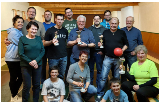
Kegelnachmittag in Kirnberg an der Mank

Einen lustigen und geselligen Nachmittag erlebten wir am 07. Jänner 2024 auf der Kegelbahn der Familie Lentsch in Kirnberg an der Mank.