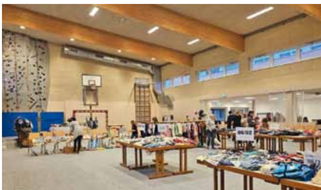
Das Angebot beim Umtauschbasar war riesig.

Weiters ist am 27. April 2024 ein Selbstausteller-Flohmarkt geplant. Infos dazu finden sie auf S. 13 dieser Gemeindezeitung!