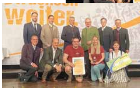
Foto rechts: Die Landjugend Stephanshart bei der Prämierung.