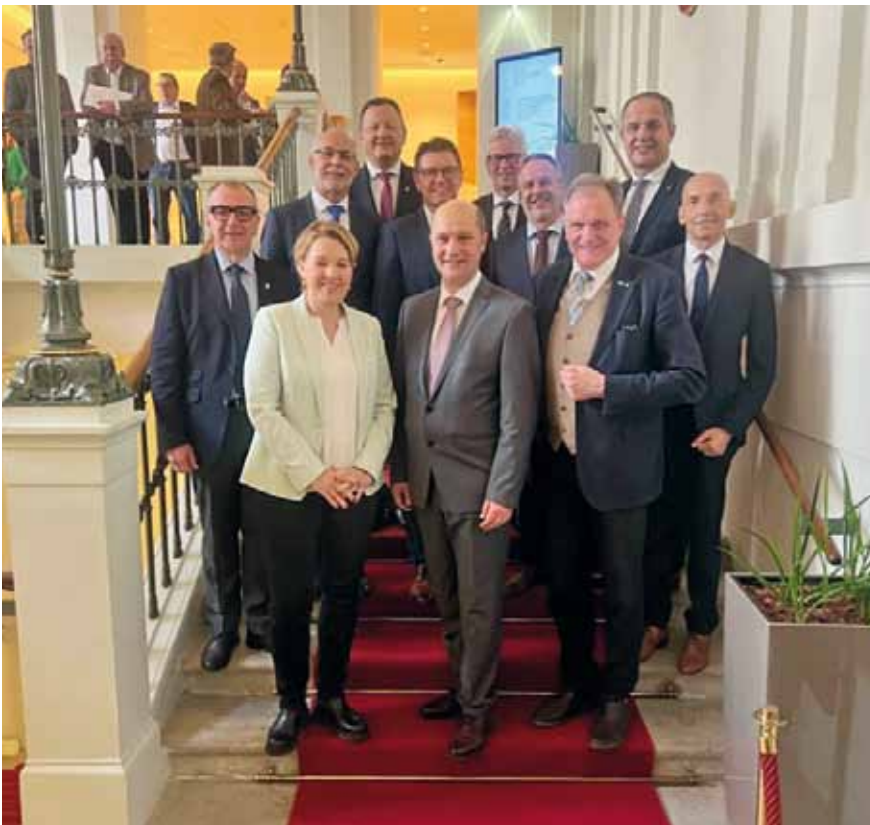
Foto: Unmittelbar nach der Wahl am 26. Februar 2024 gemeinsam mit den LandespräsidentInnen des Gemeindegewählterbundes.