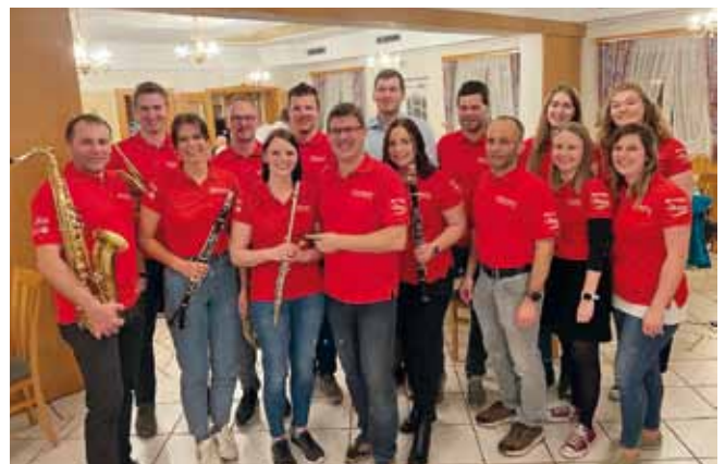
Foto: Der neu gewählte Vorstand des MV Stephanshart.