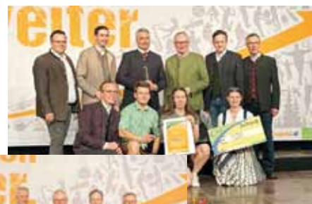
Foto rechts: Die Landjugend Ardagger bei der Prämierung.

phanshart mit „Silber“ für das Wappen am Ortsplatz. Die Preise empfangen sie aus den Händen von Bundeskanzler Karl Nehammer. Gratulation noch an unsere Nachbarn aus Neustadt/D. Sie haben den Gesamtsieg erreicht und diesen sogar schon zum zweiten Mal nach Neustadt geholt. Herzliche Gratulation zu den tollen Projekten!