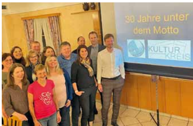
Foto: Bei der Jahreshauptversammlung wurde neben den Neuwahlen auf 30 Jahre Kulturkreis zurückblickt.