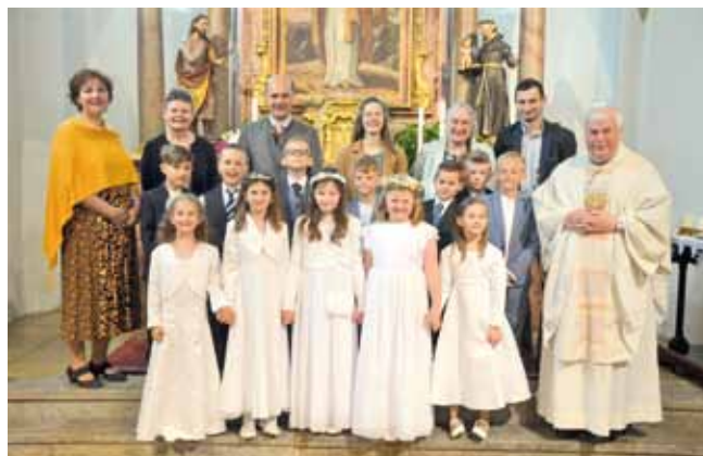
Foto: Am 11.6.2023 wurde in Ardagger Markt Erstkommunion gefeiert. Insgesamt 12 Kinder waren erstmals zur Kommunion am Altar und wurden – begleitet von Schul-, Gemeinde- und Pfarrvertretern – mit diesem Sakrament einen weiteren Schritt näher an die christliche Ortsgemeinschaft integriert.