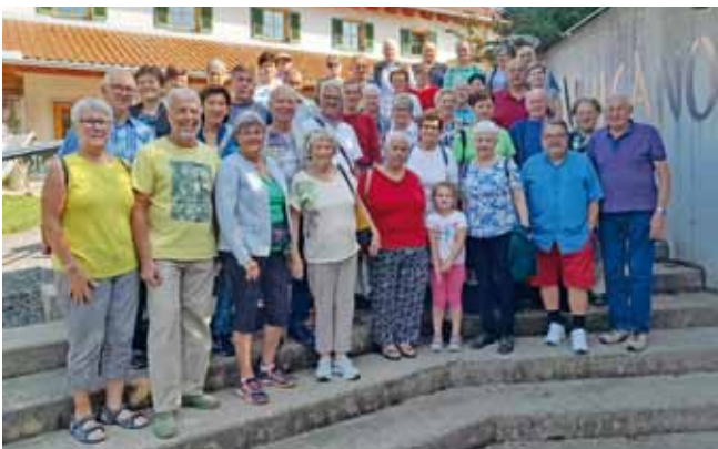
Foto: Die Senioren aus Ardagger Markt und Kollnitzberg waren unterwegs in der Oststeiermark.