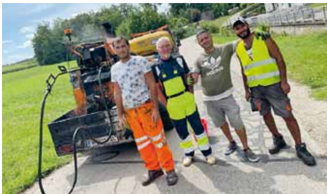
Foto: Das Team der Fa. Bit-Team, die die "Vergussarbeiten" in der Gemeinde erledigten.