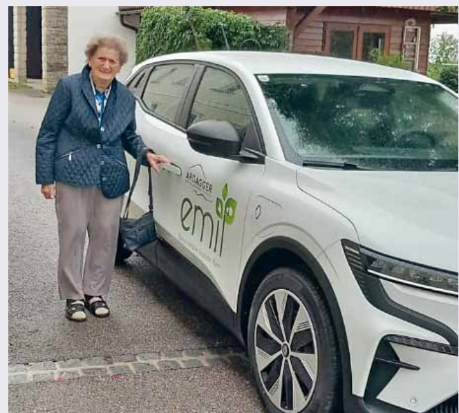
Foto: Karoline Meisinger aus Ardagger Stift war die erste Mitfahrerin im neuen EMIL.

Ehrenamtliche FahrerInnen werden laufend gesucht. Falls sie Interesse haben, melden sie sich gerne bei Christian Zehethofer unter T: 0676/833 95 19 75.