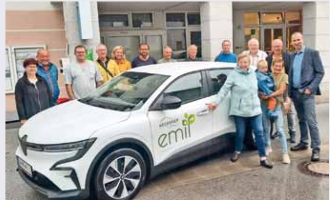
Foto: Die ehrenamtlichen FahrerInnen freuten sich ganz besonders, dass der neue EMIL Ende August in den Dienst gestellt wurde. © zVg

Ende August wurde der neue EMIL – ein Renault Megane „electric“ - an die fleißigen FahrerInnen und Fahrer übergeben. Der „alte“ EMIL hat gute Dienste geleistet. Er stand mehr als 3,5 Jahre im Einsatz und ist 160.000 km gefahren. Der neue, etwas größere und mit einem etwas höheren Einstieg ausgestattete, EMIL bietet noch mehr Komfort, vor allem auch für ältere Menschen. Herzlichen Dank allen, die sich aktiv einbringen und an