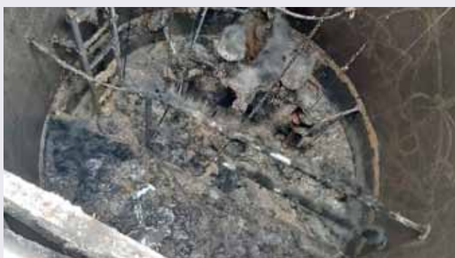
Foto: So können Küchenabfälle, Fette und Öle die Pumpen in der Kläranlage verstopfen!

Noch Fragen? Gerne sind die Mitarbeiter am Gemeindeamt und am Bauhof für Ihre Fragen da. Bitte geben Sie diese Infos an alle im Haushalt lebenden Personen weiter!