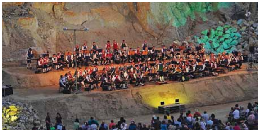
Foto: Tolles Ambiente im Rahmen des Jubiläumskonzertes im Steinbruch Odilia.