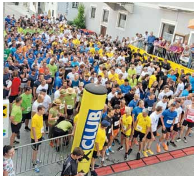
Foto: Fast 500 Läuferinnen und Läufer waren beim Businessrun am Start.

firmeninternen Gemeinschaftssinn. Und zusätzlichen wurden pro Starter € 2,- für den Verein Lebenschance im Mostviertel gespendet. Bei schönem Wetter und den tollen Menschen wieder ein großartiger Erfolg. Ganz herzlichen Dank an das Team von Burgi Brandstetter im ULC Ardagger für die perfekte Organisation.