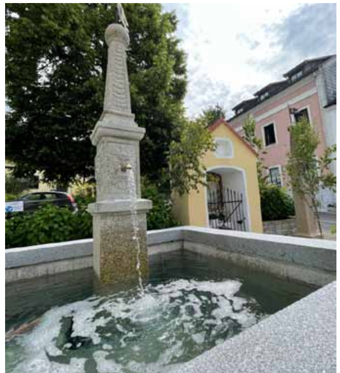
Foto: Der Marktbrunnen wurde heuer als letztes Projekt der Ortsplatzgestaltung in Ardagger Markt fertiggestellt.