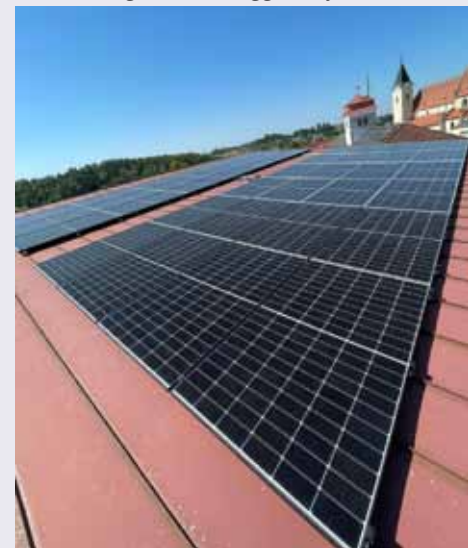
Foto: Die neue PV-Anlage auf dem Dach des Kindergarten Ardagger Stift © zVg

Derzeit sind noch weitere Projekte in Planung. Zb am Hochbehälter Kirchfeld, bei verschiedenen Kanalpumpwerken oder am Sportplatz. Weiters ist noch beabsichtigt, bestehende Anlagen zu erweitern. Am Ende sind die Investitionen in gemeindeeigene PV-Anlagen auch für die Bevölkerung nützlich, weil sie dazu dienen, Gebührenerhöhungen zu dämpfen und weil wir daraus für die Kanal- und Trinkwasserversorgung günstigere Strombezüge haben.