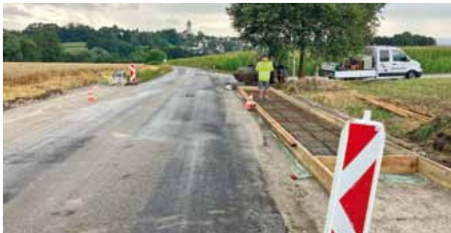
Foto: 18 Bushaltestellen wurden behindertengerecht adaptiert.

In den letzten Monaten wurden insgesamt 18 Platzerl, betoniert und barrierefrei hergestellt. Diese neuen Bus-Einstiegsmöglichkeiten wurden dort errichtet, wo noch keine behindertengerechten Einstiege gegeben sind. Am Ende sind die Auftritts-bereiche 12 m lang, ca. 14 cm hoch und 1,5 m tief und jeweils seitlich mit einer Anrampung für Rollstühle, Rollator oder Kinderwägen versehen. Die VOR-Niederflur-Busse können nun stufenlos betreten werden.