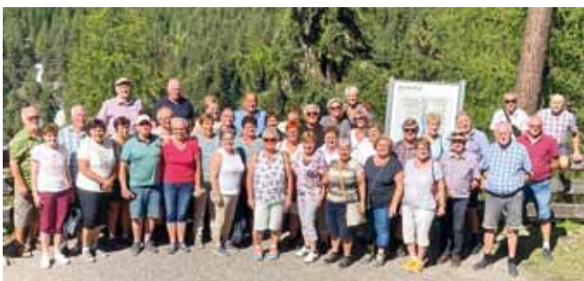
Foto: Die Senioren aus Stephanshart waren 5 Tage in Tirol unterwegs.