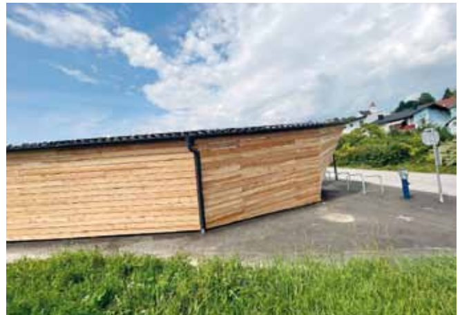
Foto: Der neue Infopoint im Donauwellenpark.