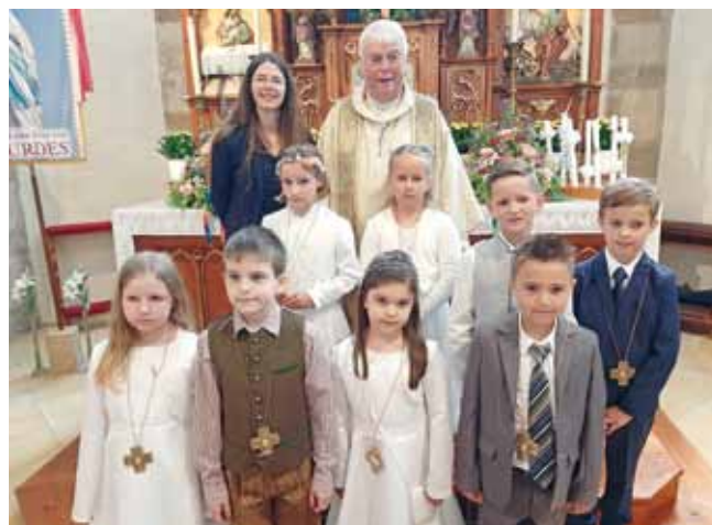
Foto oben: Am 18.6.2023 waren 9 Kinder in Kollnitzberg zum ersten Mal bei der hl. Kommunion. Traditionell wurden sie mit der Musik in die Kirche begleitet und gingen im Rahmen einer wunderbar gestalteten Feier erstmals zum Altar.