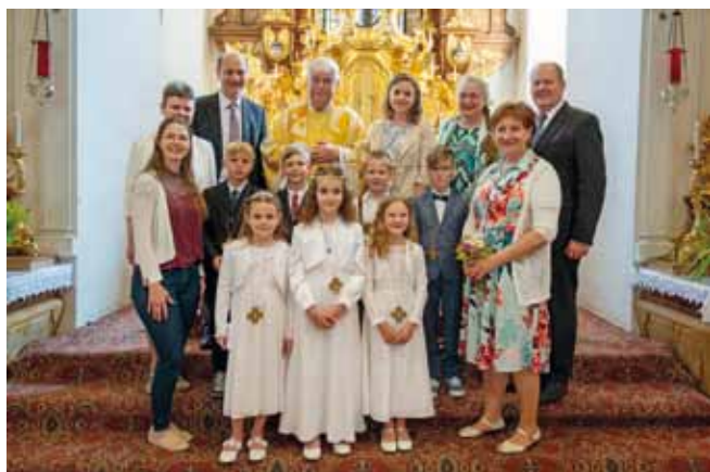
Foto: 8 Kinder waren am 19. Juni in Ardagger Stift das erste Mal bei der heiligen Kommunion.

sowie bei den Verantwortlichen der Pfarren herzlich für die Unterstützung, Vorbereitung und Begleitung der Kinder bedanken. Es waren schöne Feste, die die Kinder gemeinsam mit Ihren Familien, Paten und Verwandten feiern konnten.