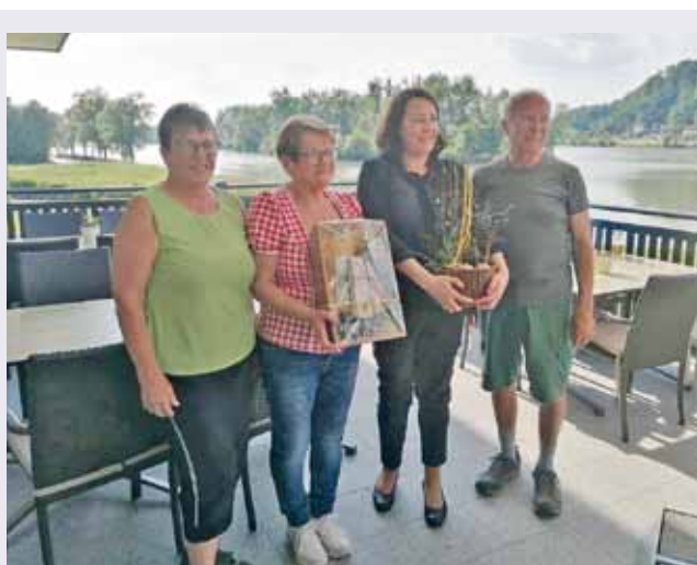
Foto: Vielen Dank für viele 55+Aktivitäten an Theresia Neuheimer, Leopoldine Elser, Mag. Birgit Weichinger und Johann Göbl.