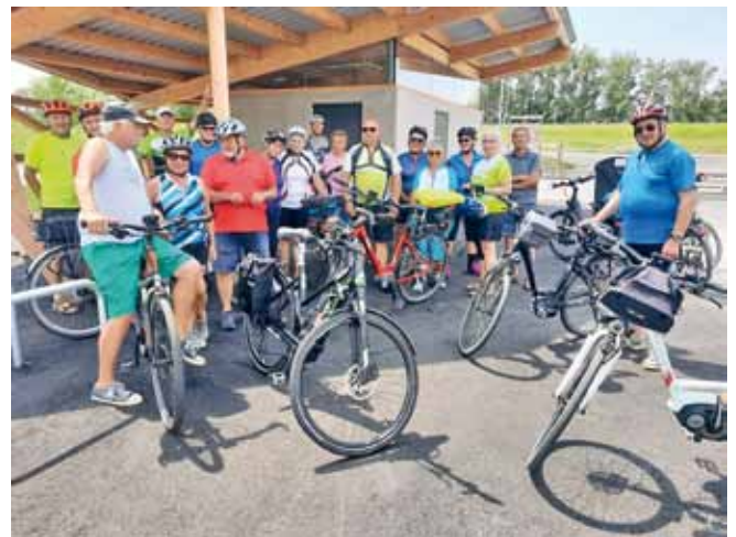
Foto: Die Markter Senioren beim Start zur Donau-Radlrunde Ardagger-Greiner Brücke-Mitterkirchen-Wallsee-Ardagger. © zVg

Grein über die Donaubrücke Grein. Sodann geht's weiter nach Dornach und Mitterkirchen am Donauradweg. Dann überquert man die Kraftwerksbrücke Wallsee. Auf dem Donauradweg Richtung Ardagger kommt man an der Riesentrostbirn vorbei und zurück zum Ausgangspunkt. Die Strecke ist ca. 34 km lang und enthält nur geringe Steigungen.