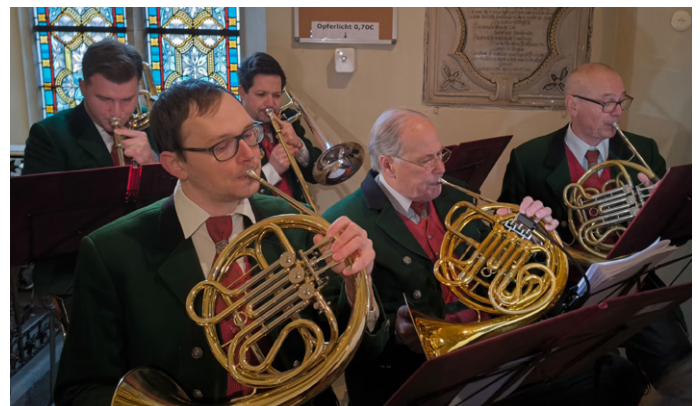
Text & Foto: Musikverein Erla

Im Anschluss an die Messe lud die Pfarre Erla zum Fastensuppen-Essen auf den Kirchenvorplatz ein. Der Duft von hausgemachter Suppe und frischem Brot erfüllte die Luft. Dieses Fastensuppen-Essen ist eine herzliche Einladung an die Kirchenbesucher, sich nach der Messe zu stärken und in geselliger Runde zusammenzukommen.