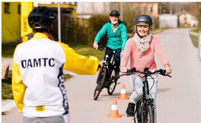
E-Bike Kurs

Im sicheren Umfeld erläutern Experten die Besonderheiten der Elektrofahrer, gehen auf die zusätzlichen Bedienmöglichkeiten ein und geben praktische Tipps. Der nächste Gratis-Trainingskurs findet am Freitag 19.04.2024 vormittags oder nachmittags am Vorplatz des Valentiniums statt. Anmeldungen bitte bei Frau Gschwantner Annemarie unter 0664/3839887