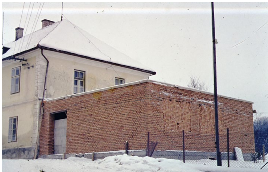
Zubau bei Volksschule Winter 1962/63