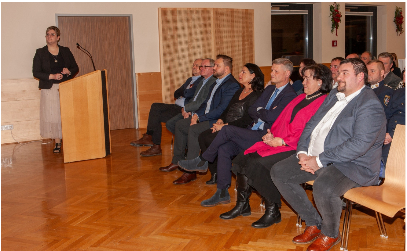
Foto: Eine Vielzahl von Gästen aus dem öffentlichen Leben folgte der Einladung der Gemeinde