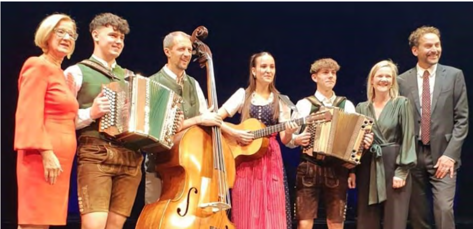
Foto: Nina Lambart, Philipp Hofmacher, Ludwig Nussbaumer und Musikschulpädagoge Johannes Lagler spielten auf der großen Bühne im NÖ Festspielhaus gekonnt auf