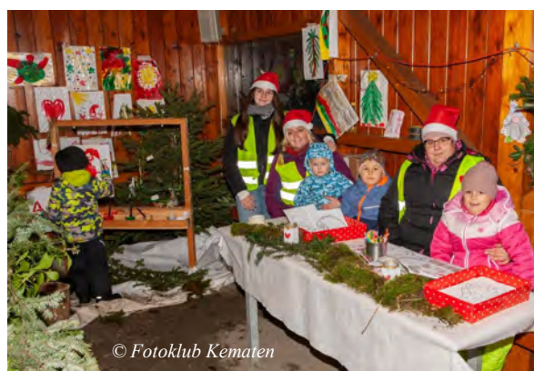
Foto: Bgm. Juliana Günther freut sich mit den Besuchern über das vielfältige Angebot der Aussteller