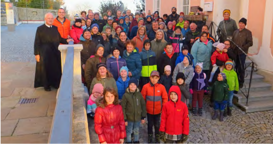
Foto: Die Naturfreunde bedanken sich bei den teilnehmenden Vereinen, der Pfarre Sonntagberg und allen, die zum Erfolg dieses großartigen Events beigetragen haben. Eine gelungene Benefizveranstaltung für die Lebenshilfe Hiesbach im Zeichen der Menschlichkeit.