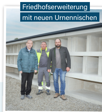
Friedhofserweiterung mit neuen Urnennischen

Seitdem die baulichen Änderungen an der Friedhofskapelle fertiggestellt wurden, kann diese, im Falle einer Aufbahrung, beim seitlichen Eingang barrierefrei betreten werden.