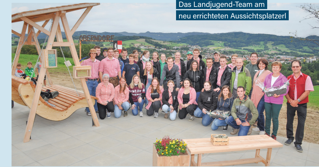
Das Landjugend-Team am neu errichteten Aussichtsplatzlerl

Am Sonntag konnte um 15 Uhr das fertige Projekt präsentiert werden.