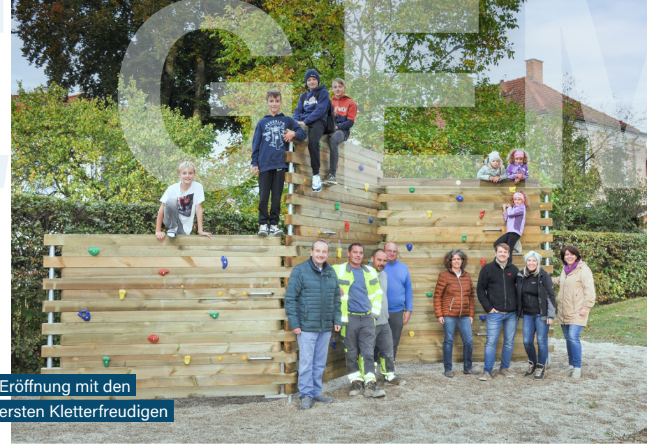
Eröffnung mit den ersten Kletterfreudigen