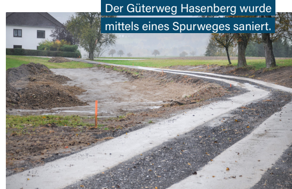
Der Güterweg Hasenberg wurde mittels eines Spurweges saniert.

Im kommenden Jahr ist die Straßengestaltung über den Listberg bis zum Oberen Markt vorgesehen. Weiters sind, wie alljährlich, Sanierungsmaßnahmen einiger Güterwege geplant. Hierbei richtet man sich nach den vorhandenen finanziellen Mitteln.