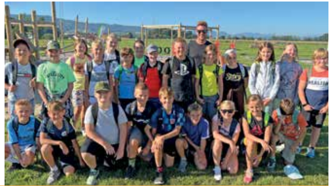
Die beiden ersten Klassen haben sich mittlerweile gut in der Mittelschule Ramingtal eingelebt.