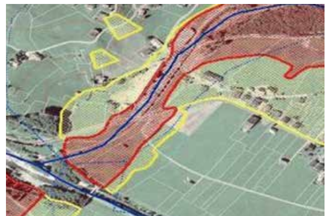
Der Gefahrenzonenplan lag vier Wochen zur Einsichtnahme am Gemeindeamt auf.

Der Gefahrenzonenplan ist ein Instrument, um Gefahren in verschiedenen Einzugsgebieten darzustellen. Erstellt wird der Gefahrenzonenplan, kurz auch GZP, von den Mitarbeitern und Mitarbeiterinnen der Dienststellen der Wildbach- und Lawinerverbauung. Durch Begehung der Einzugsgebiete, Recherche in Chroniken, Bewertung von „Stummen Zeugen“, Auswertung von verschiedenen Themenkarten (Geologie, Hydrologie, Morphologie, etc.) und Berechnung (teilweise Simulation) eines 150-jährlichen Bemessungsereignisses, kann der Gefahrenzonenplan (kurz GZP) erstellt werden.