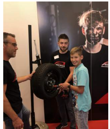
Die Exkursion zum Karriere-Clubbing in Waidhofen/Ybbs fand im Zuge der Berufsorientierung statt.