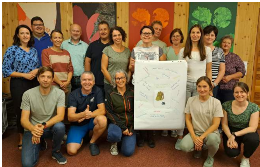
Die Ybbsitzer Teilnehmer des diesjährigen Vorsorge Aktiv-Kurses trafen sich von März bis September wöchentlich zum Thema Gesundheit und Fitness.