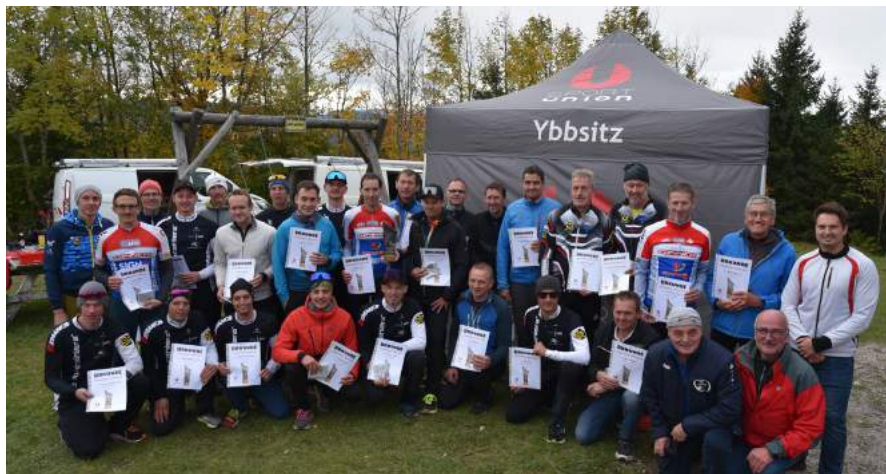
Die Sportunion Ybbsitz darf sich über 2 gelungene Sportbewerbe bei besten Bedingungen bei der Prochenberg-Trophy 2023 freuen.

Die Sportunion Ybbsitz als Veranstalter gratuliert allen Teilnehmern zu den ausgezeichneten Leistungen und bedankt sich bei allen Sponsoren, Helfern und der Ortsgruppe Ybbsitz des Alpenvereines für die gute Zusammenarbeit.