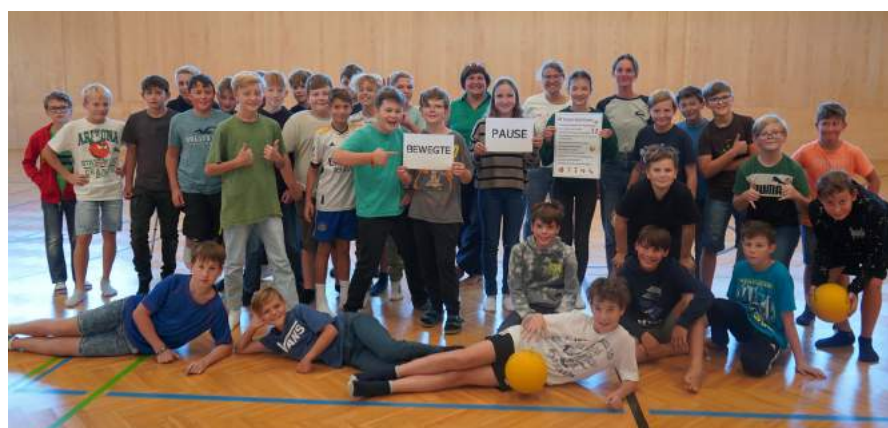
Kraft tanken für den Rest des Schultages im Turnsaal der Mittelschule