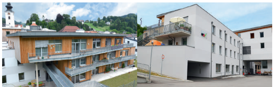
Im Haus des Lebens - Unter der Leithen gibt es derzeit freie Wohnungen

Aktuell gibt es 2 freie Wohnungen . Infos jederzeit gerne bei Frau Elisabeth Schasching unter Tel. 0680 / 1293540. WAV - Gemeinnützige Bau- und Siedlungsgenossenschaft Waldviertel, Tel. 02846 / 7015 www.wav-wohnen.at