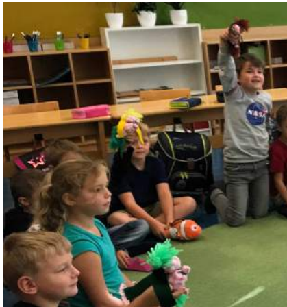
Die Kinder der 2a Klasse spielten bei ihrer Aufführung mit selbstgenähten Ichbinichs