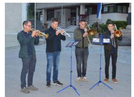
Musikalisch umrahmt wurde die Feier durch ein Bläserensemble des Musikvereins