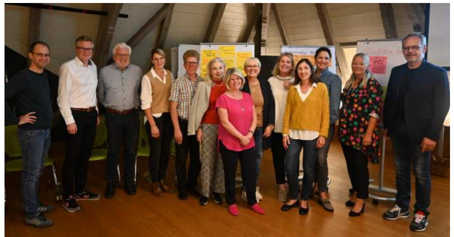
Im Dachgeschoss der Schmiede - Markt 3 - fand die Mitgliederversammlung der Zentrumsbelegung Ybbsitz und anschließend ein Workshop geleitet von Stefan Hackl statt.