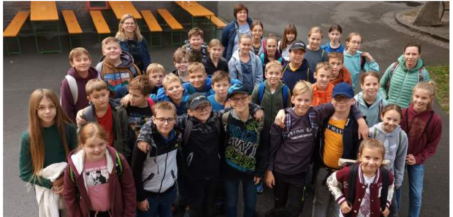
Die Schülerinnen und Schüler der zweiten Klassen der Mittelschule tauchten im Oktober in spannende Themenbereiche ein und entdeckten die Leidenschaft für MINT-Fächer.

Das „Karriere-Clubbing“ fand zum achten Mal im Schloss Rothschild in Waidhofen an der Ybbs statt. 34 Mostviertler Betriebe aus den Bezirken Amstetten, Scheibbs, Melk und Waidhofen präsentierten das breite Spektrum von Lehrberufen in der Region. Die Schülerinnen und Schüler der 3. und 4. Klassen nutzten das Angebot, um sich zu informieren.