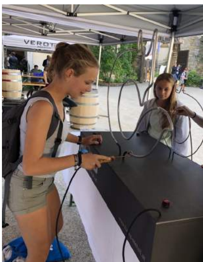
Geschick war am Stand von Fa. Fuchs Metalltechnik gefragt