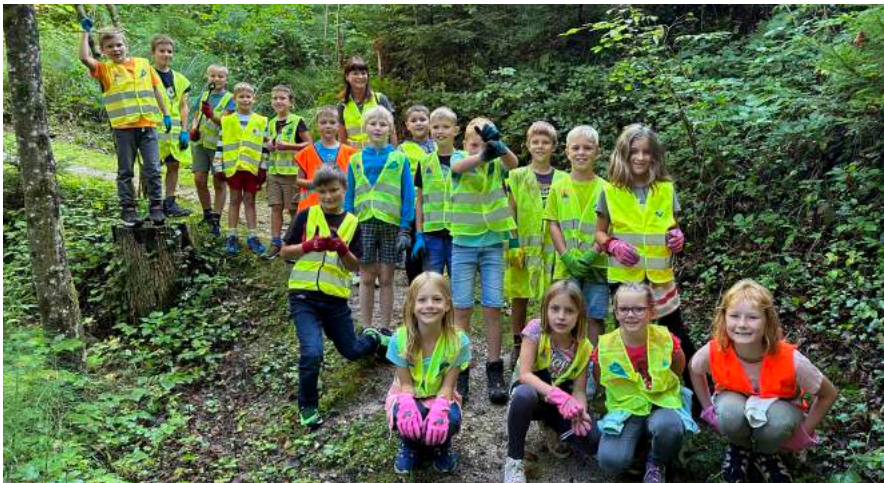
Auch die 3a Klasse machten sich auf die Müllsuche

Anlässlich des weltweiten Klimastreiktages Mitte September setzten auch wir ein öffentliches Zeichen für den Klimaschutz. Statt zu streiken, waren alle Klassen unter dem Titel „Müll-FREI-Tag“ in Ybbsitz unterwegs und sammelten Müll. Die Kinder wurden dadurch darauf aufmerksam gemacht,