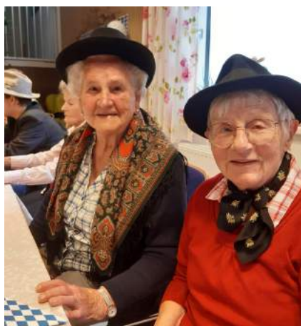
Am 21. Oktober feierte man im Haus des Lebens das Oktoberfest.

Im Juni verbrachten die Bewohner des „Haus des Lebens“ einen unvergesslichen Tag in Lunz - mit Führung im Haus der Wildnis, Mittagessen und gemeinsamer Bootsfahrt - danke an Frau Hannelore Wiesbauer, die diesen Tag so perfekt organisierte.