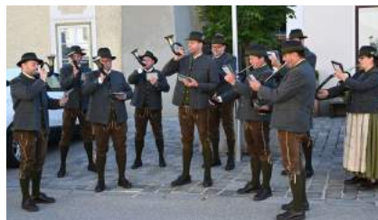
Zur Eröffnung des Messermarktes spielten die Ybbsitzer Jagdhornbläser auf.