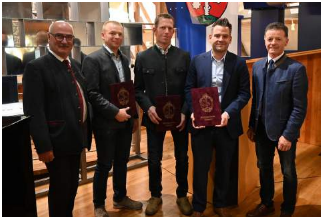
Verleihung von Dankesurkunden an ausgeschiedene Gemeinderäte