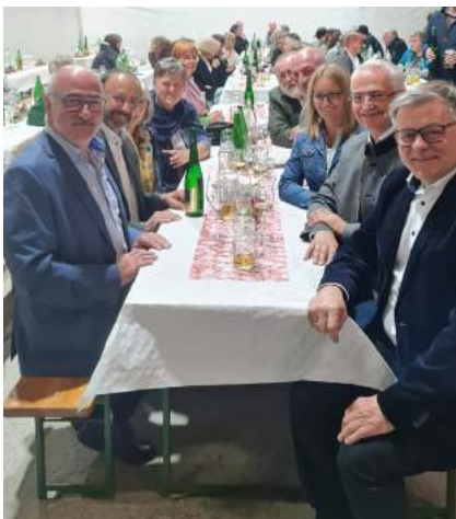
Am Firmengelände des Bauunternehmens wurde die Umbenennung feierlich begonnen.