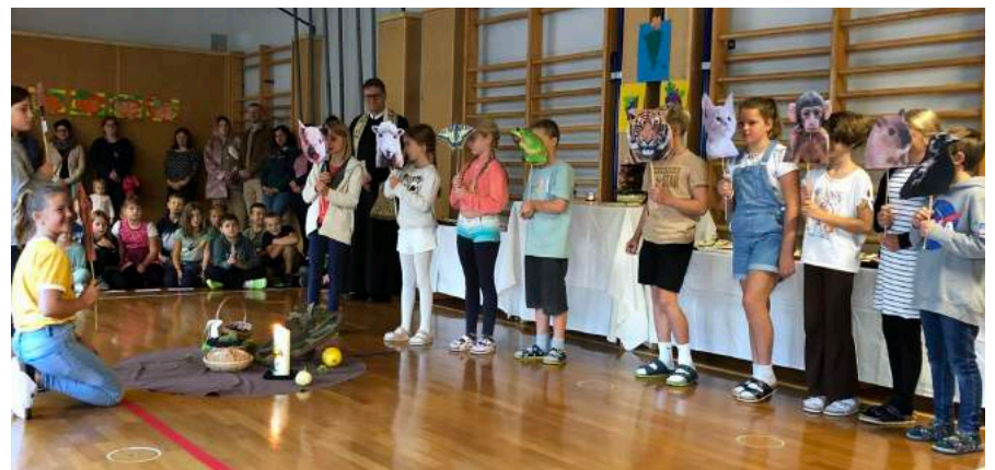
Erntedankfest im Turnsaal: „Schützt unsere Erde!“ lautete der Appell der Kinder in ihren Rollen als Tiere.

Passend dazu beschäftigten sich die Kinder der 2a Klasse mit dem bekannten Bilderbuch „Das kleine Ich-bin-Ich“. Auch die 2b Klasse konnte ihr schauspielerisches Können unter Beweis stellen. Sie erfreuten mit ihrer gelungenen Darbietung der Geschichte des Buchstabenvogels die Kinder der 1b Klasse.