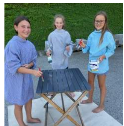
Eine gemütliche Atmosphäre wurde geschaffen, es wurde geschliffen, dekoriert und gebohrt.